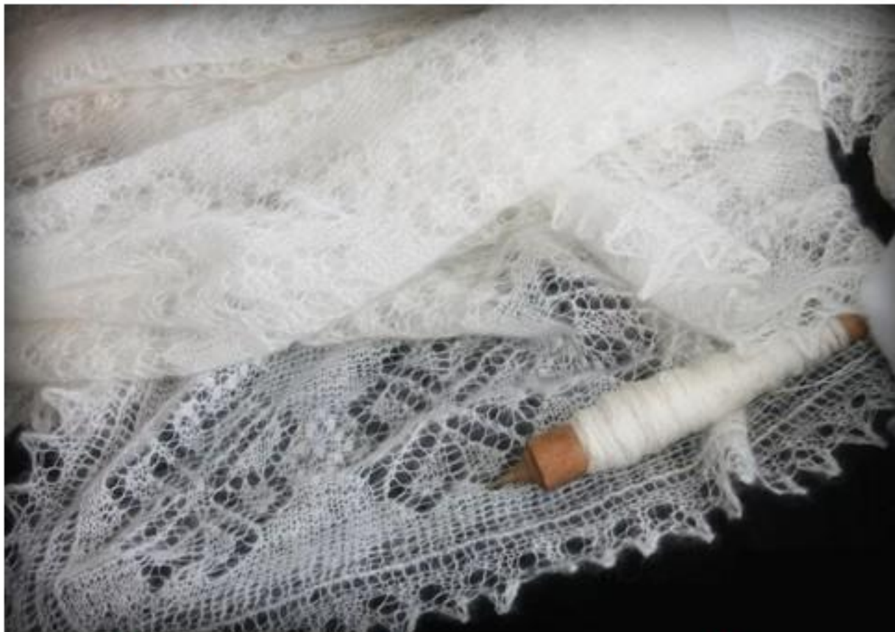
Оренбургский пуховый платок