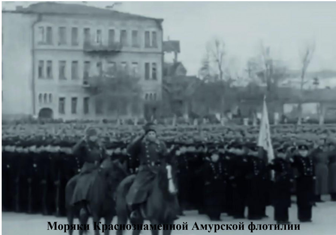
Моряки Краснознаменной Амурской флотилии

Для парада использовали дивизии из Забайкалья и Дальнего Востока, направлявшиеся на фронт через Куйбышев