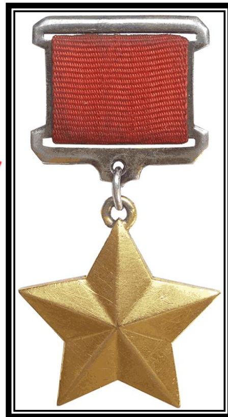
Званием ГЕРОЙ СОВЕТСКОГО САЮЗА