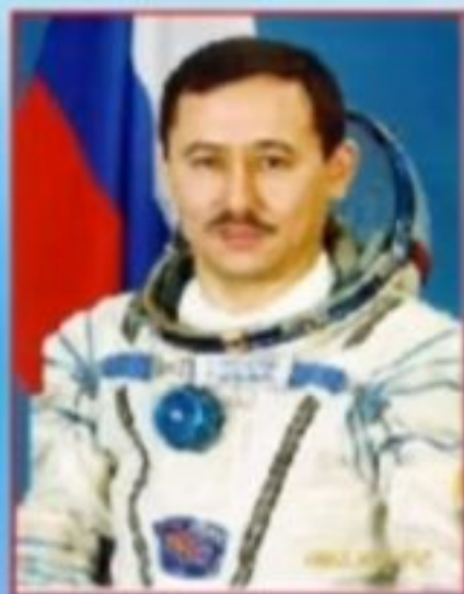
♦ Талғат Мұсабаев