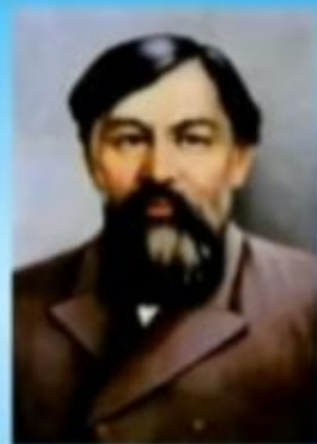
Б.Алтынсаринге 175 жыл