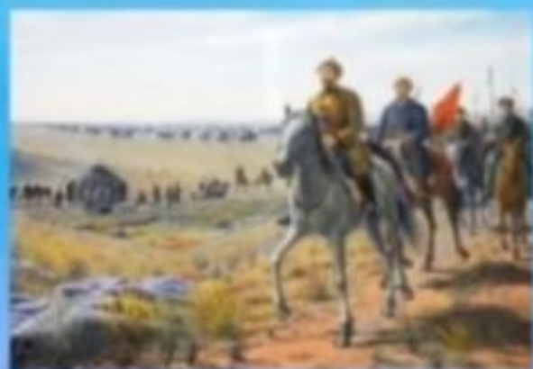
Ұлт –азаттық көтеріліске 100 жыл

Қазақстандықтар барлығы 17 медаль (3 алтын, 5 күміс, 9 қола) алып, ел спорты тарихында жұлделер саны жөнінен рекордтық көрсеткішке қол жеткізді.