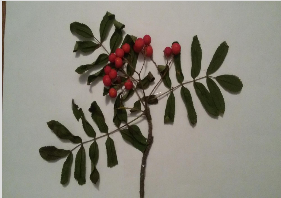
Высушенные листья рябины

Плоды рябины потребляются в свежем виде, в виде варенья, джемов, киселей, настоек, пастилы, мармелада, желе, а также мочёная и маринованная. Рябиновый сок используется в ликёро-водочном производстве. Порошок, приготовленный из сушёных плодов, идёт на начинку для пирогов. Плоды рябины использовались в народной медицине; в научной медицине рябина не используется.