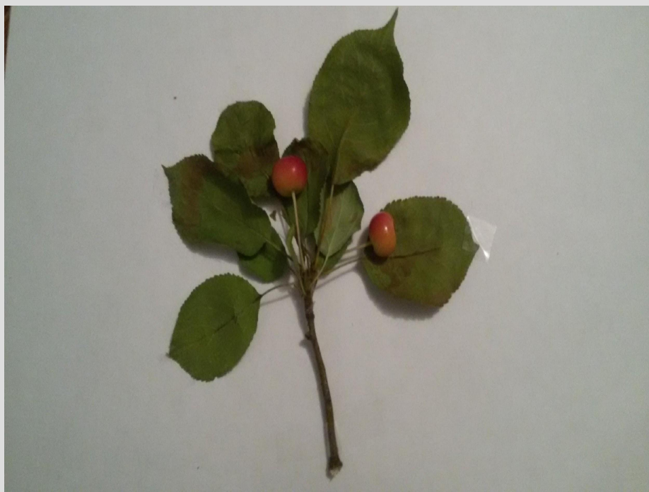
Высушенные листья ранетки

Описание места посадки яблонь “ранеток” мало чем отличается от выбора места для посадки любой яблони. Желательно, чтобы грунтовые воды залегали не слишком близко к поверхности земли, сам участок хорошо освещался и был не слишком ветреным.