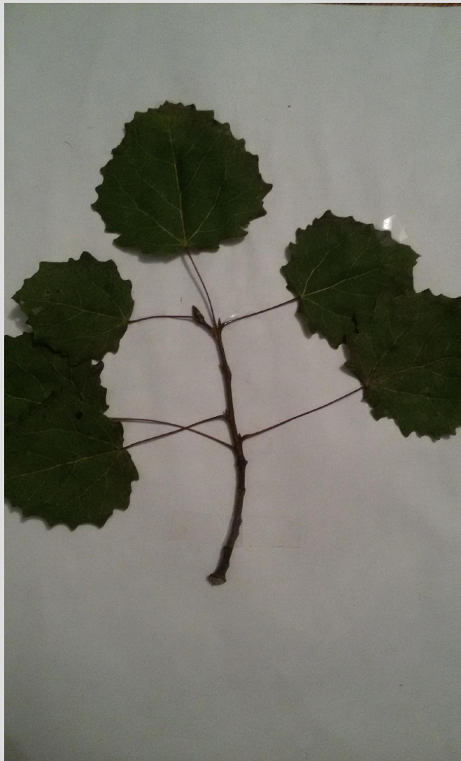
Высушенные листья берёзы