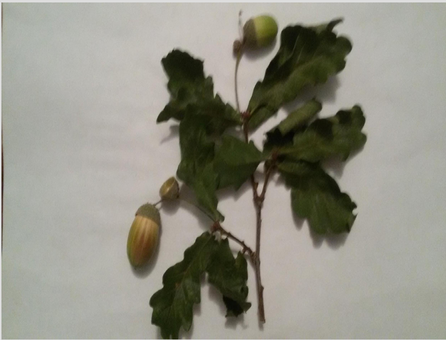
Высушенные листья дуба

Дуб пробковый — применяется для создания пробок для бутылок.