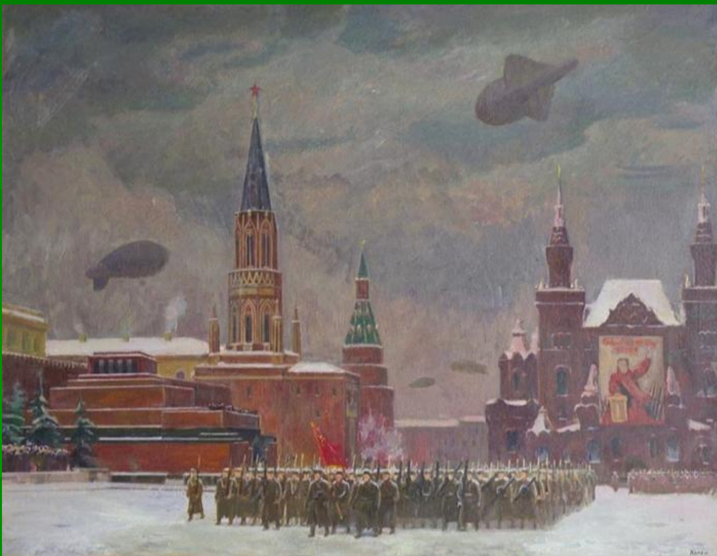
«Парад на Красной площади 7 ноября 1941 года» Коган Феня Самойловна.