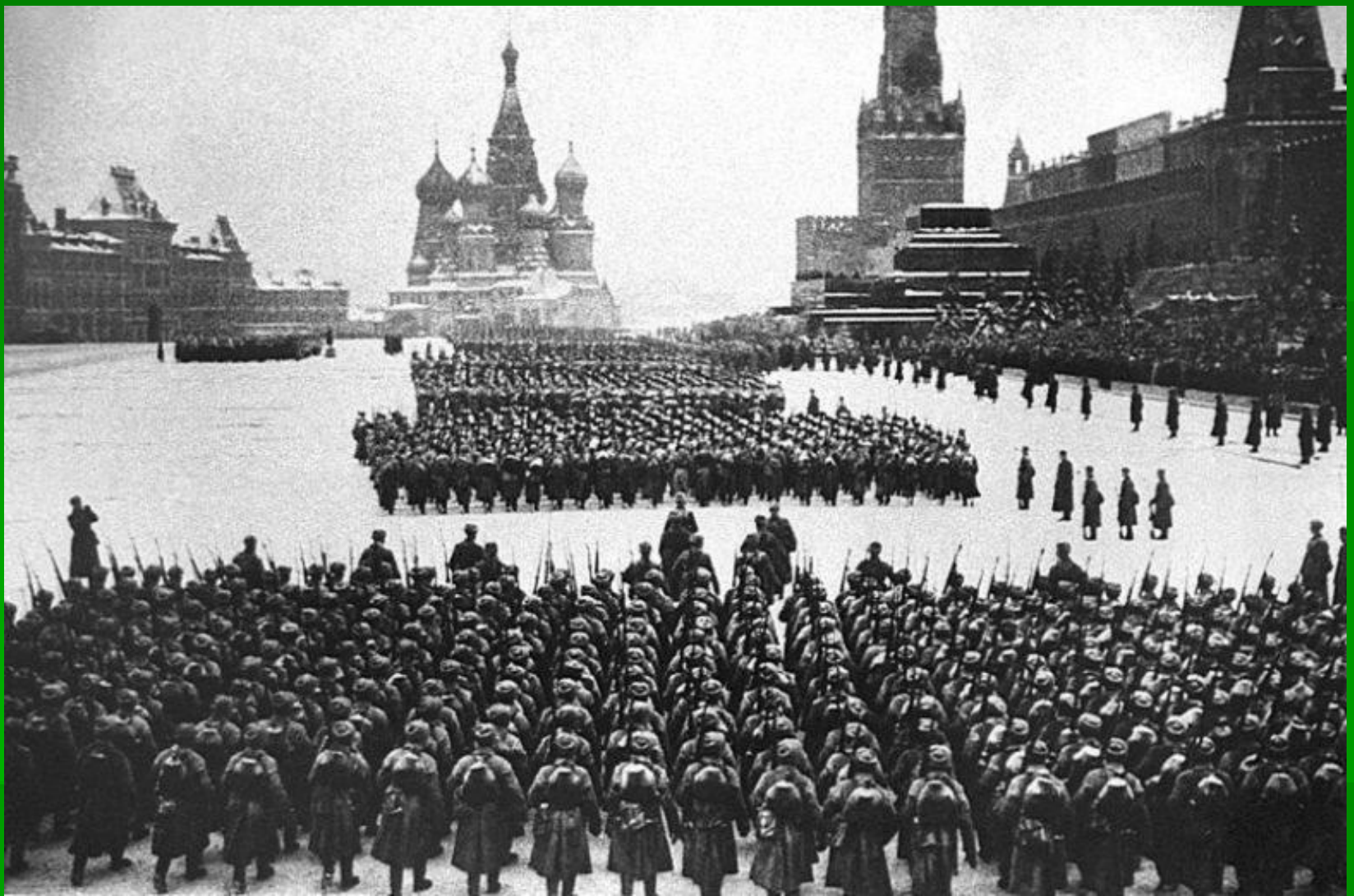
Военный парад на Красной площади 7 ноября 1941 года. Колонны бойцов проходят мимо Мавзолея Ленина.