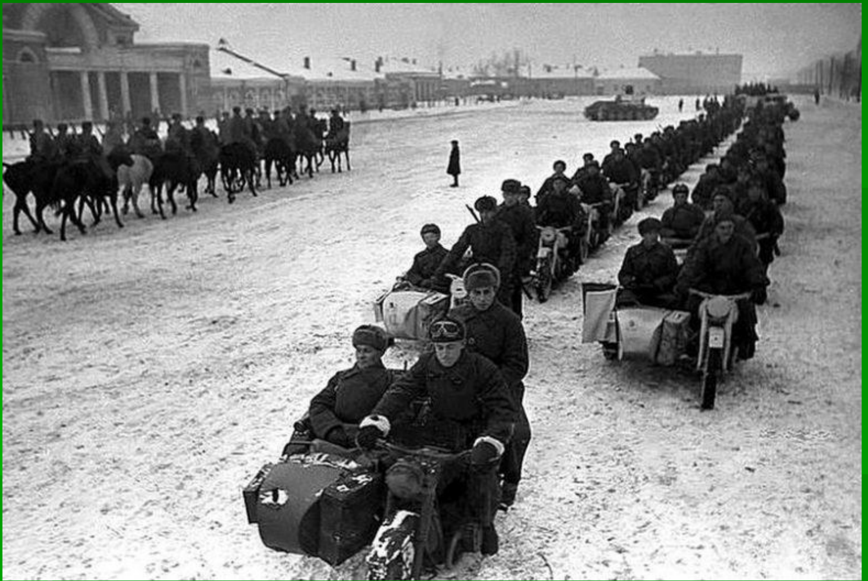
Мотоциклисты и конница