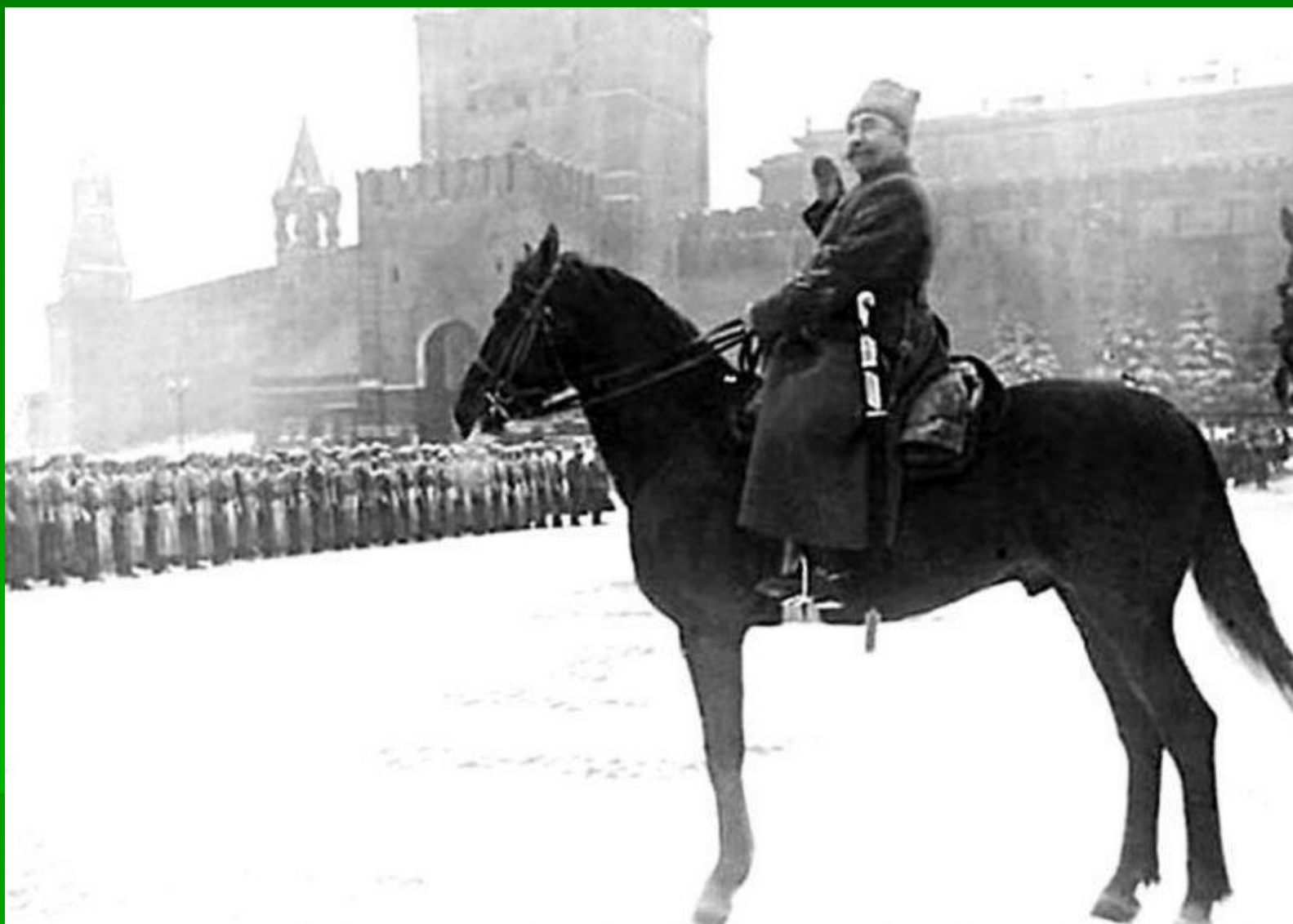
Маршал С. М. Буденный принимает военный парад