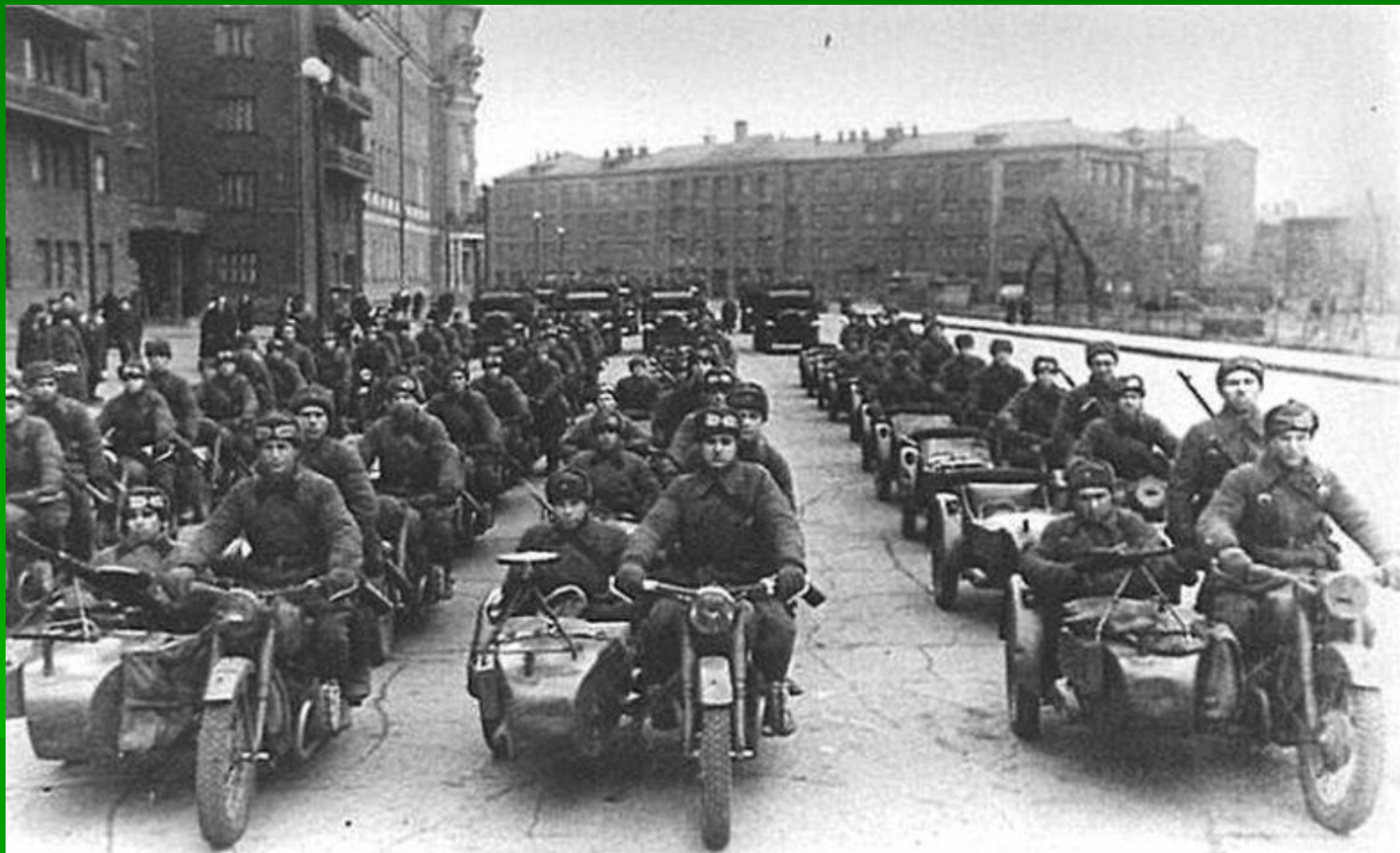
Колонна мотоциклистов перед парадом. Москва, Садовое Кольцо