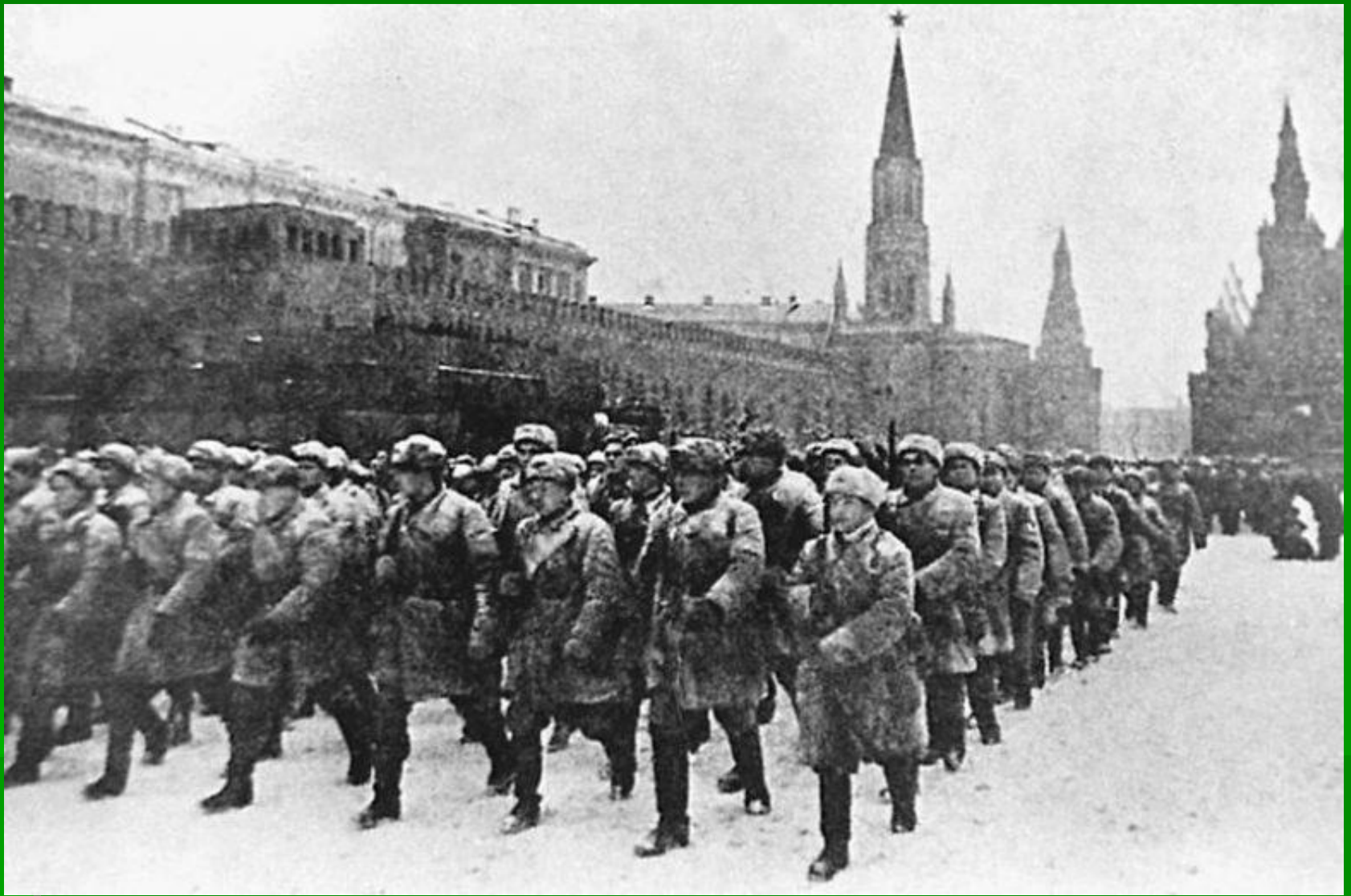
Прохождение пехотных частей по Красной площади