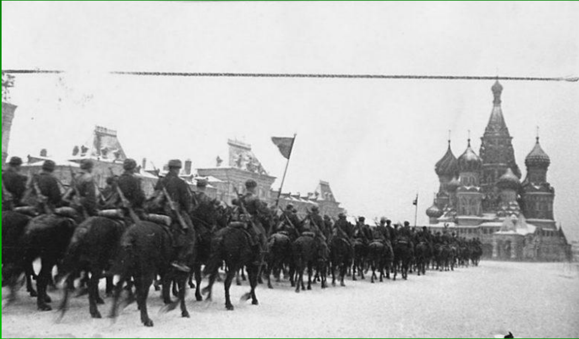
Прохождение конницы по Красной площади