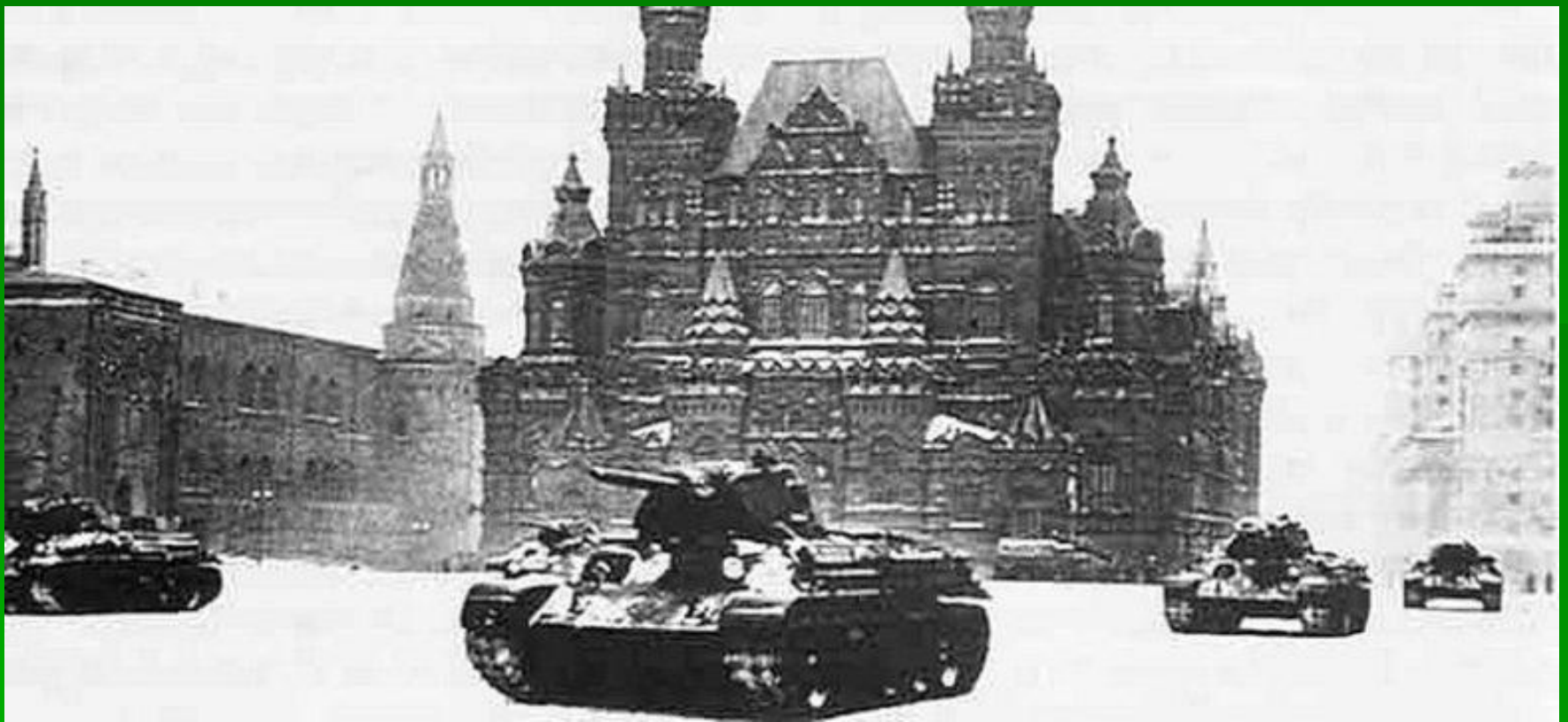
Советские средние танки Т-34