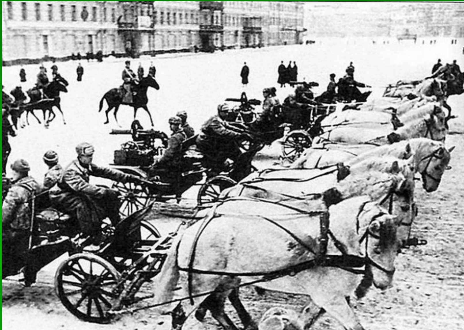
Пулеметные тачанки на Военном параде