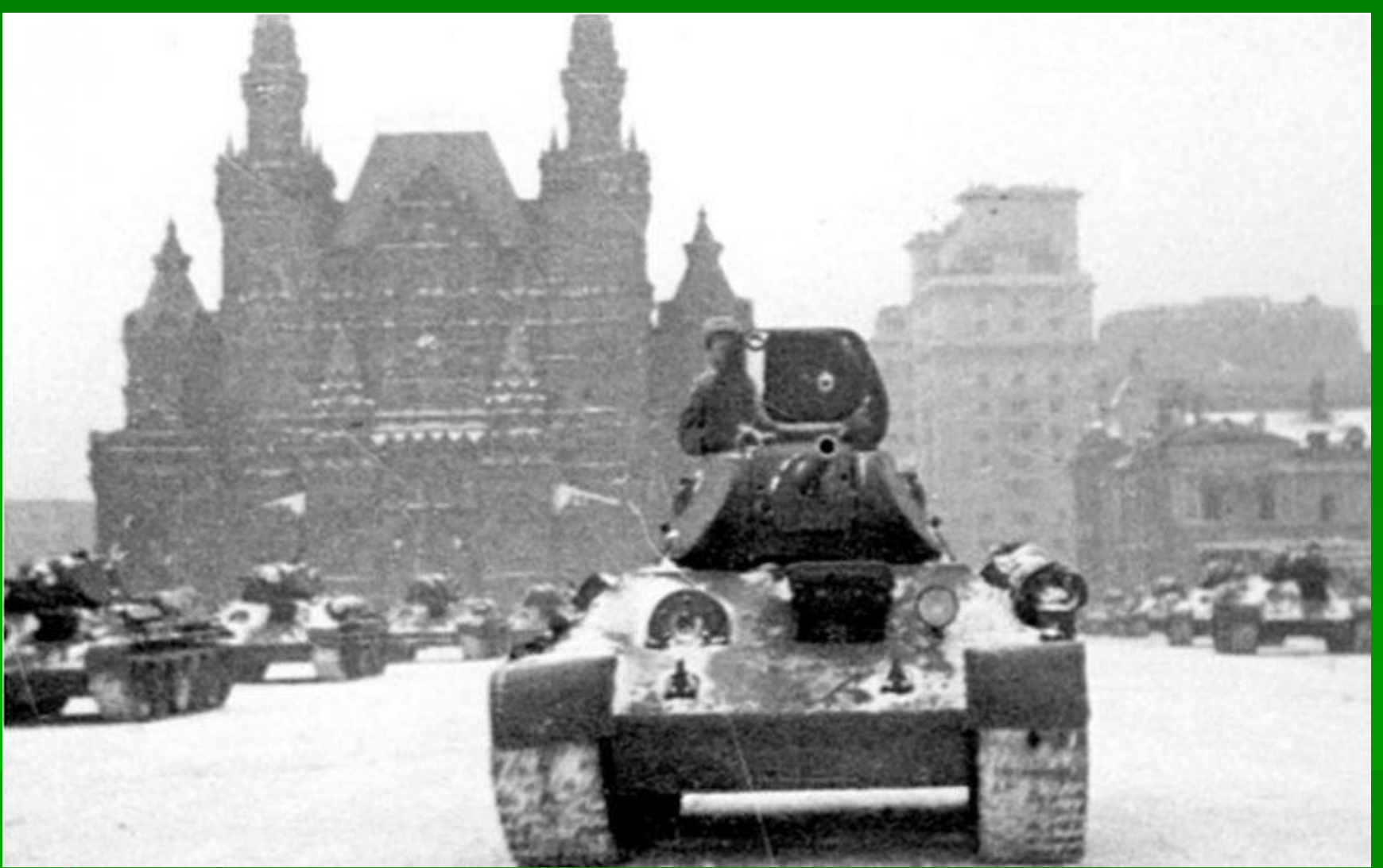
Танки Т-34 на Красной площади