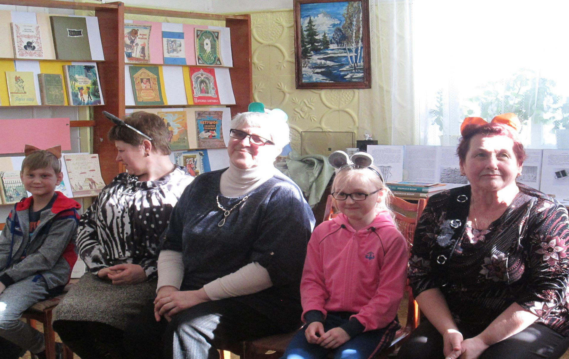
Участие Совета бабушек «Игры моего детства»