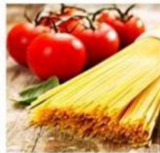
Фасовка макаронных изделий