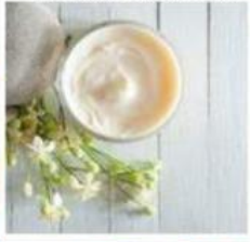
Кремы, Лосьоны, Средства ухода