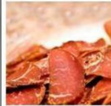
Фасовка мясных снеков