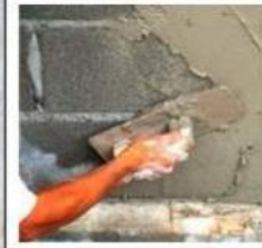
Строительные и Отделочные мат-лы