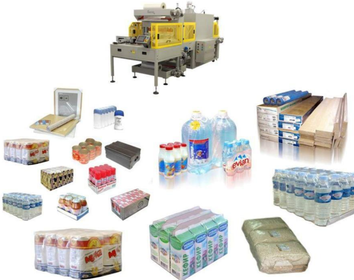
Упаковка в термоусадочную плёнку