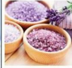
Соли для ванны