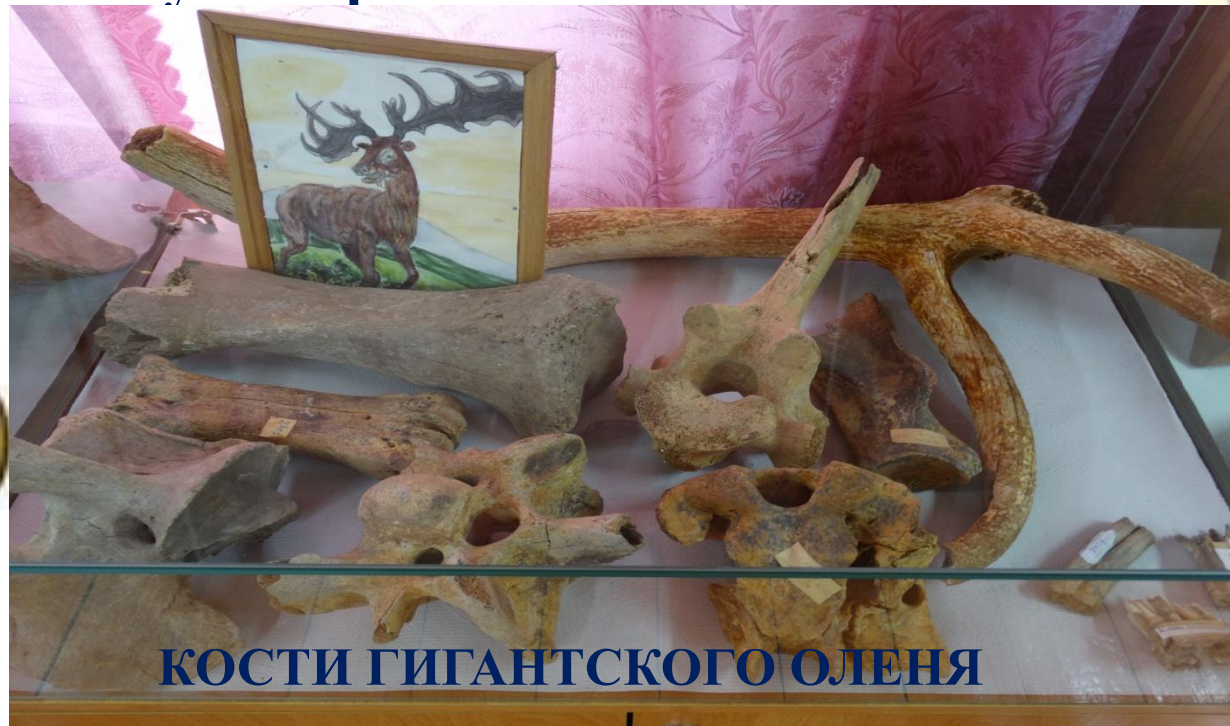
КОСТИ ГИГАНТСКОГО ОЛЕНЯ

Огромные ветвистые рога гигантский олень сбрасывал один раз в год, затем они снова отрастали за небольшой промежуток времени.