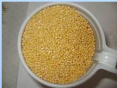
Пшено – один из самых любимых видов пищи

Очень интересным фактом оказалось, что птицы не клюют одну и ту же пищу каждый день. Т.е.они соблюдают разнообразие в пищевом рационе.