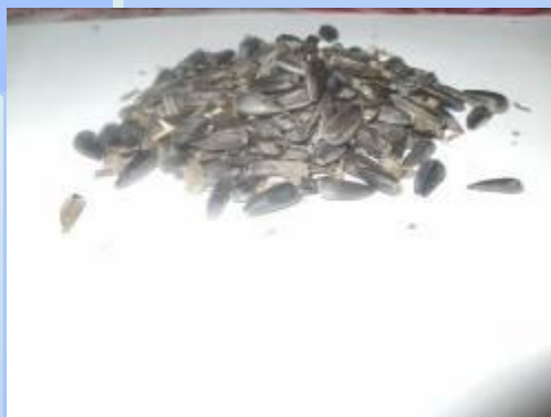
Подсолнечник – довольно популярный корм