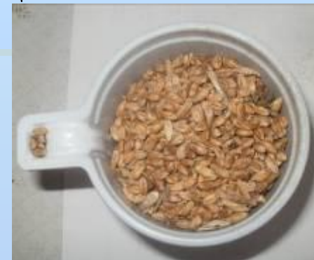
Пшеница – корм, если больше нечего покушать

Так же заметили, что воробьи уступают в борьбе за пищу (предположительно, из-за преимущества синиц над воробьями). Дятел кормится всегда в одиночестве, соперники отлетают в сторону и ждут, пока тот не улетит.