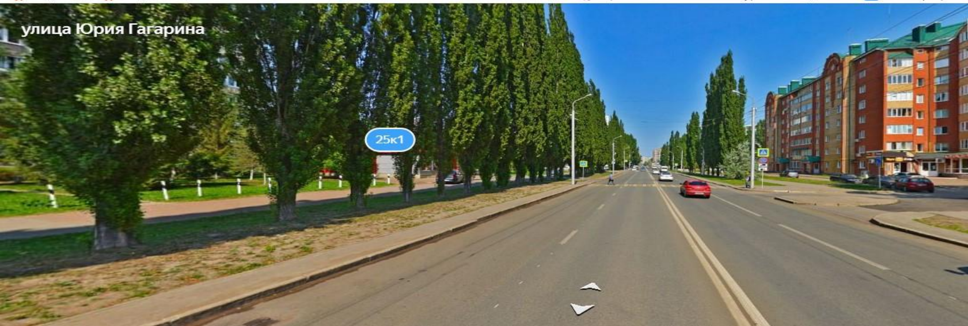
улица Юрия Гагарина

На улице Ю.Гагарина очень развита инфраструктура. Здесь располагаются различные учреждения: медицинские, образовательные, социальные, досуговые, в том числе две библиотеки, а еще магазины, рестораны кафе, рынки. Есть всё для удобства. К сожалению, нашей улице не хватает парковой зоны, все жители микрорайона надеются, что на улице М. Рыльского, которая как раз перпендикулярно пересекает улицу Гагарина появится прогулочная парковая зона в ближайшее время, где жители и гости города могли бы