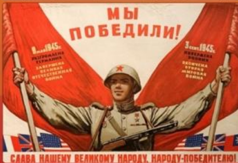
СЛАВА НАШЕМУ ВЕЛИКОМУ НАРОДУ, НАРОДУ-ПОБЕДИТЕЛЮ!