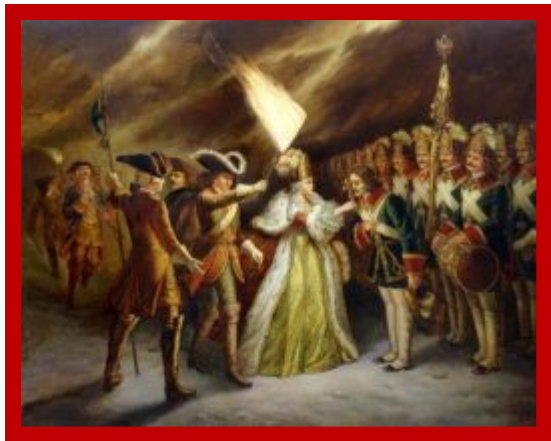
Филипп М.Р. Присяга преображенцев дочери Петра Великого.