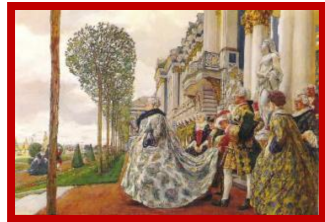
Императрица Елизавета Петровна в Царском Селе Е. Е. Лансере