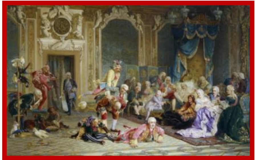
Якоби Валерий Иванович. Шуты при дворе императрицы Анны Иоанновны.

1730-1740 гг. - правление Анны Иоанновны Племянница Петра I, вышедшая замуж за герцога Курляндского, прозвище «Кровавая», «Митавская затворница».