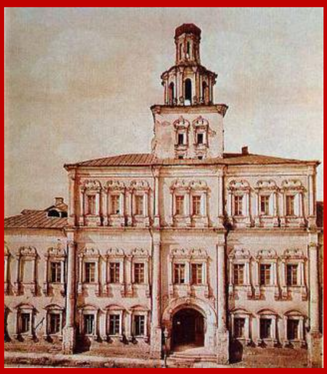
Первое здание Московского университета