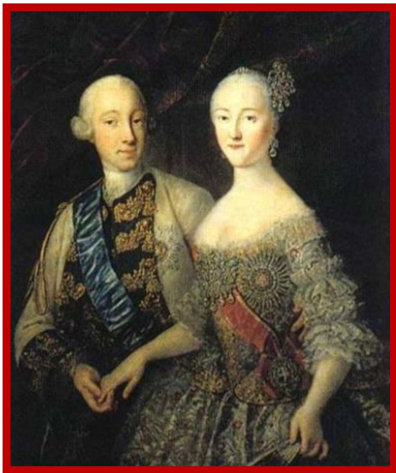
Петр Федорович, великий князь, Екатерина Алексеевна, великая княгиня.