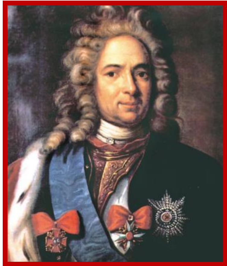
Александр Данилович Меншиков