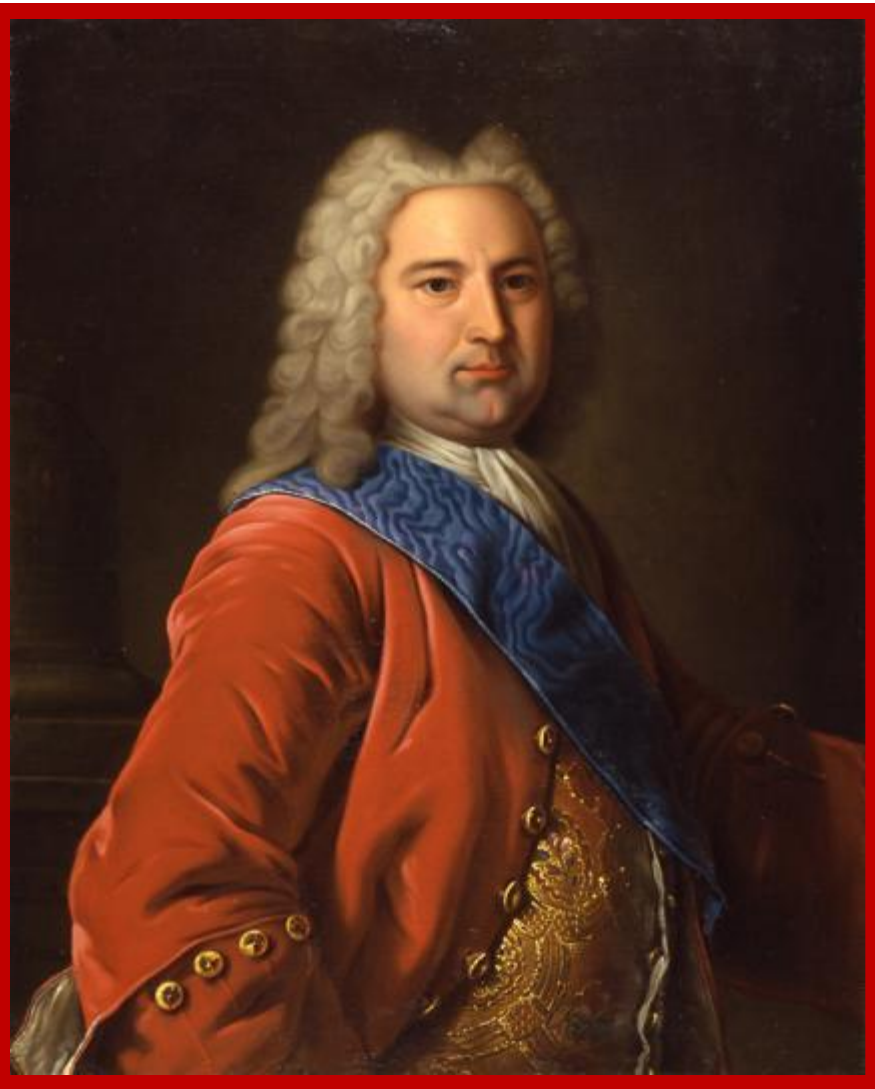
Эрнст Бирон – фаворит Анны Иоанновны