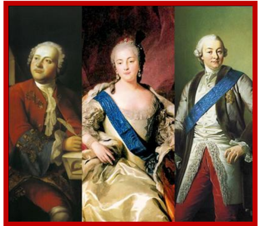
Михаил Васильевич Ломоносов, императрица Елизавета Петровна, Иван Иванович Шувалов.