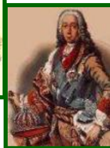
Петр III 1761-1762