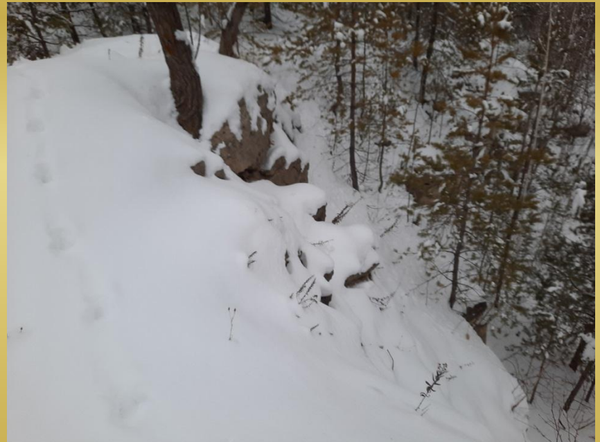
Осыпной склон покрытый снегом.