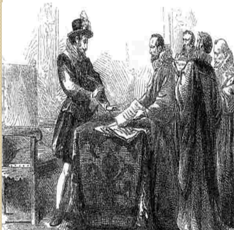
Подписание Нантского эдикта

13 апреля 1598 Генрих IV издал Нантский эдикт, который подвел итог религиозным войнам. «... Мы позволили и позволяем исповедующим ... реформированную религию жить и обитать во всех городах и местах нашего королевства... без преследований, притеснений и принуждений». Из Нантского эдикта