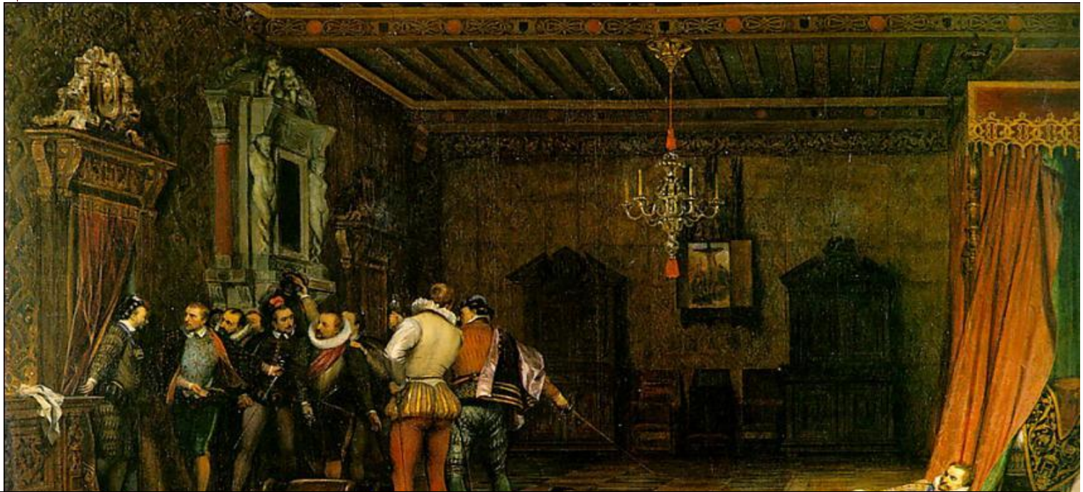
Религиозные войны во Франции