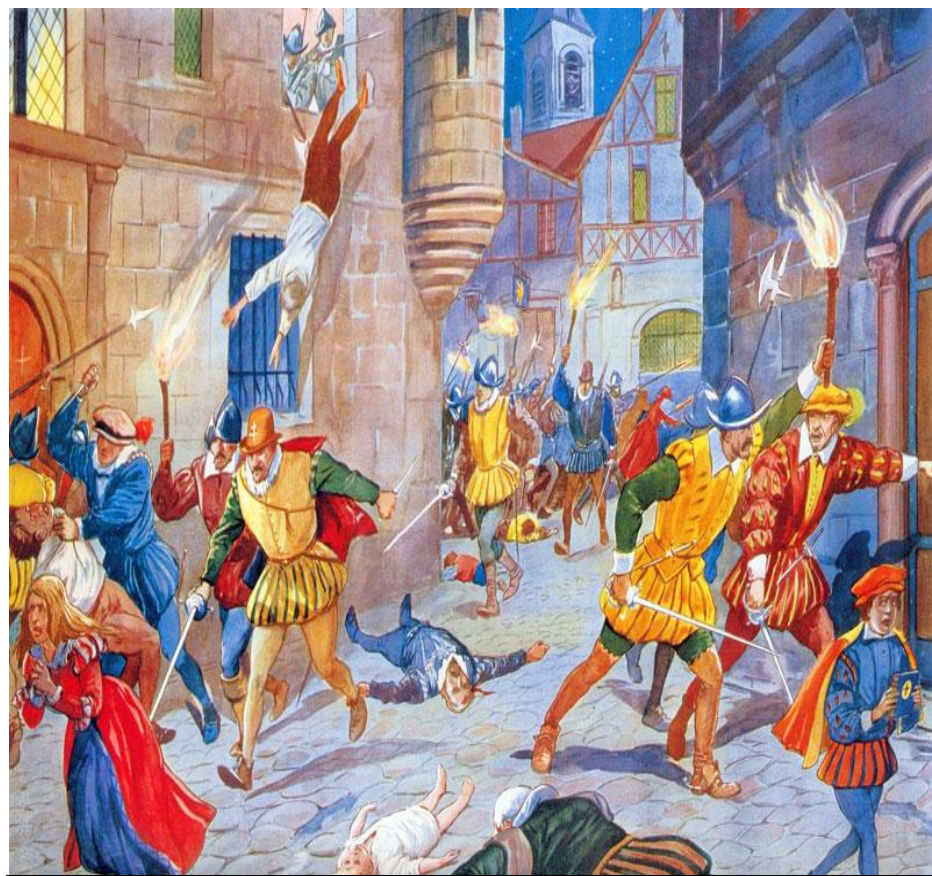
Резня во имя веры .

В этой борьбе гугеноты получали помощь от Англии и протестантских князей Германии, а католики — от Испании.