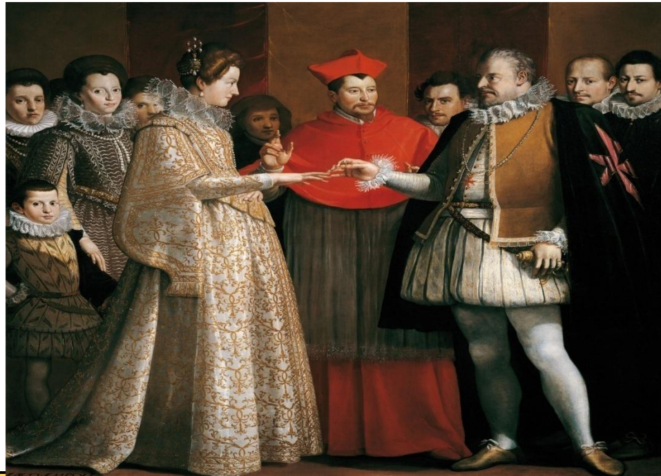
Свадьба Маргариты Валуа и Генриха Бурбона

Чтобы примирить католиков и гугенотов Карл IX решил выдать замуж свою сестру Маргариту за вождя протестантов короля Наваррского Генриха Бурбона. Свадьбу назначили на август 1572 года. Около 20 тыс. гугенотов съехались в Париж. Этим решили воспользоваться вожди католиков во главе с Екатериной Медичи, уничтожив протестантов во главе с адмиралом Колиньи.