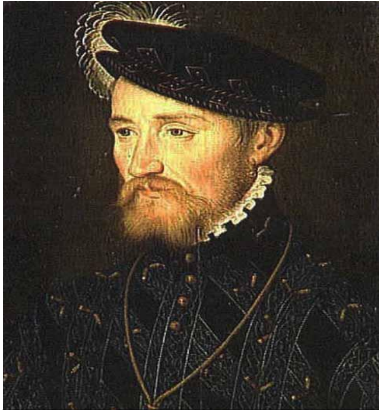
Герцог Франсуа де Гиз