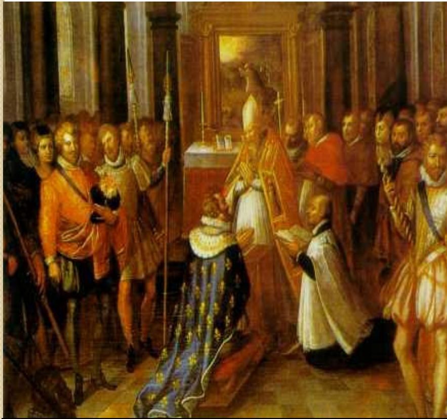
Париж стоит мессы

В ходе дальнейшей борьбы французская королевская династия Валуа пресеклась; ближайшим наследником оказался гугенот Генрих Наваррский. Он взошел на трон под именем Генриха IV (1589–1610 гг.), положил начало