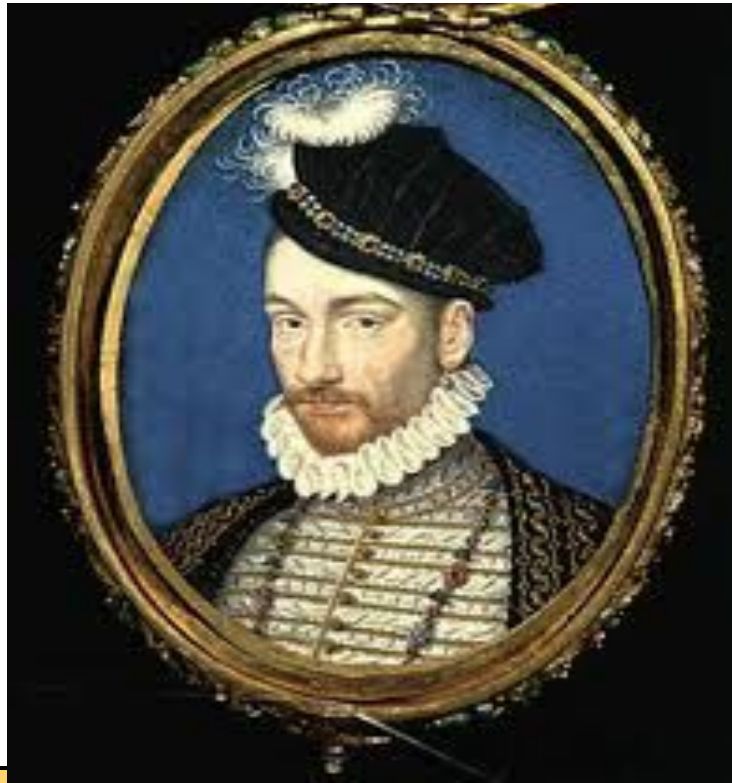
Король Франции Карл IX

С 1560 по 1574 г. во Франции правил король из династии Валуа. Он не был сильным правителем. Фактически вся власть принадлежала его матери Екатерине Медичи.