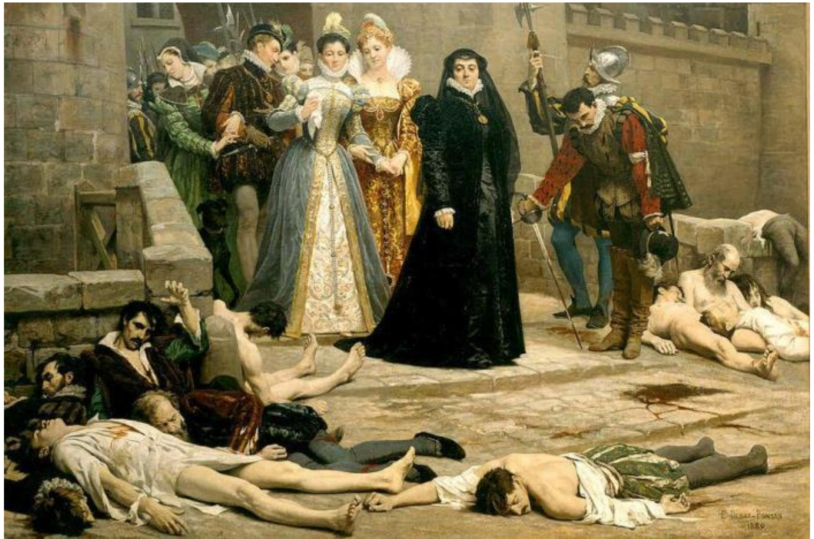
Эдуард Деба-Понсан. Утро около ворот Лувра, 1880. Фрагмент