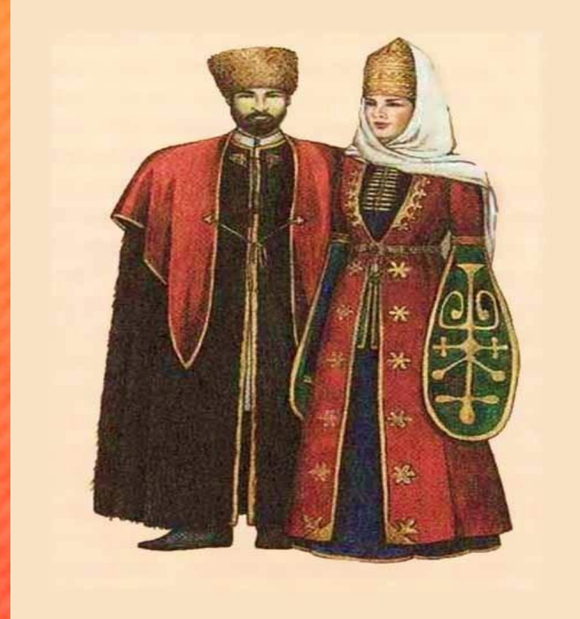
Народный костюм адыгов