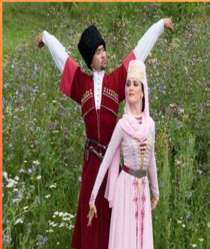
Народный костюм ингушей