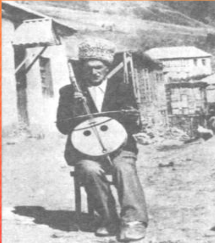
Национальный инструмент - чагана

АВАРЦЫ — самый многочисленный народ современной республики Дагестан.