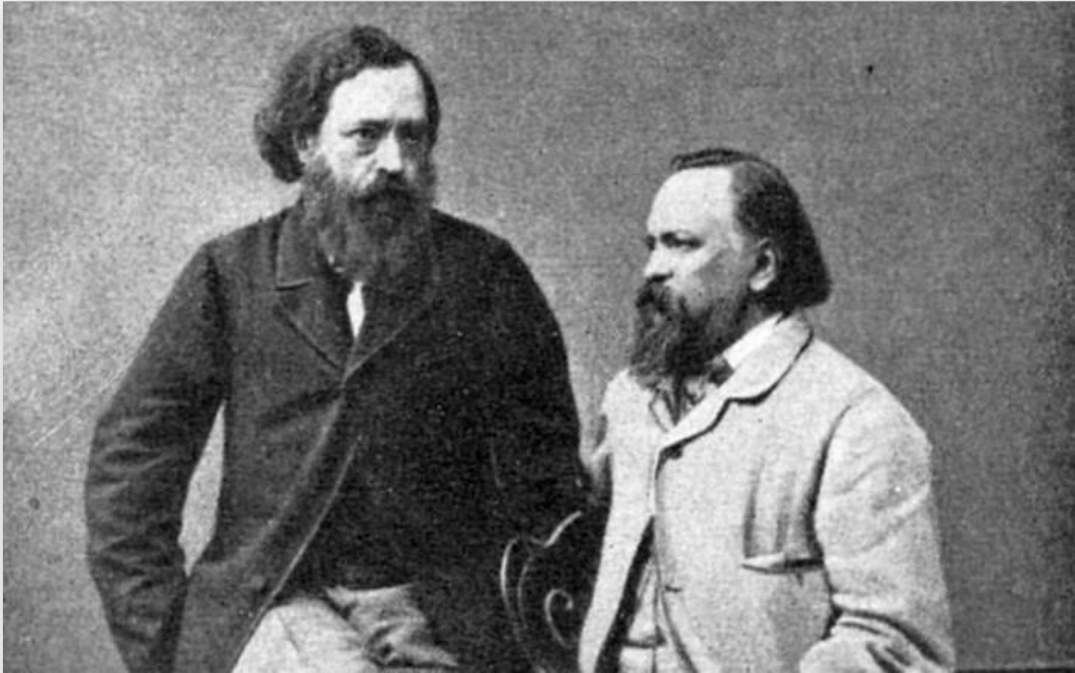
А.И.Герцен и Н.П.Огарёв - издатели газеты «Колокол»