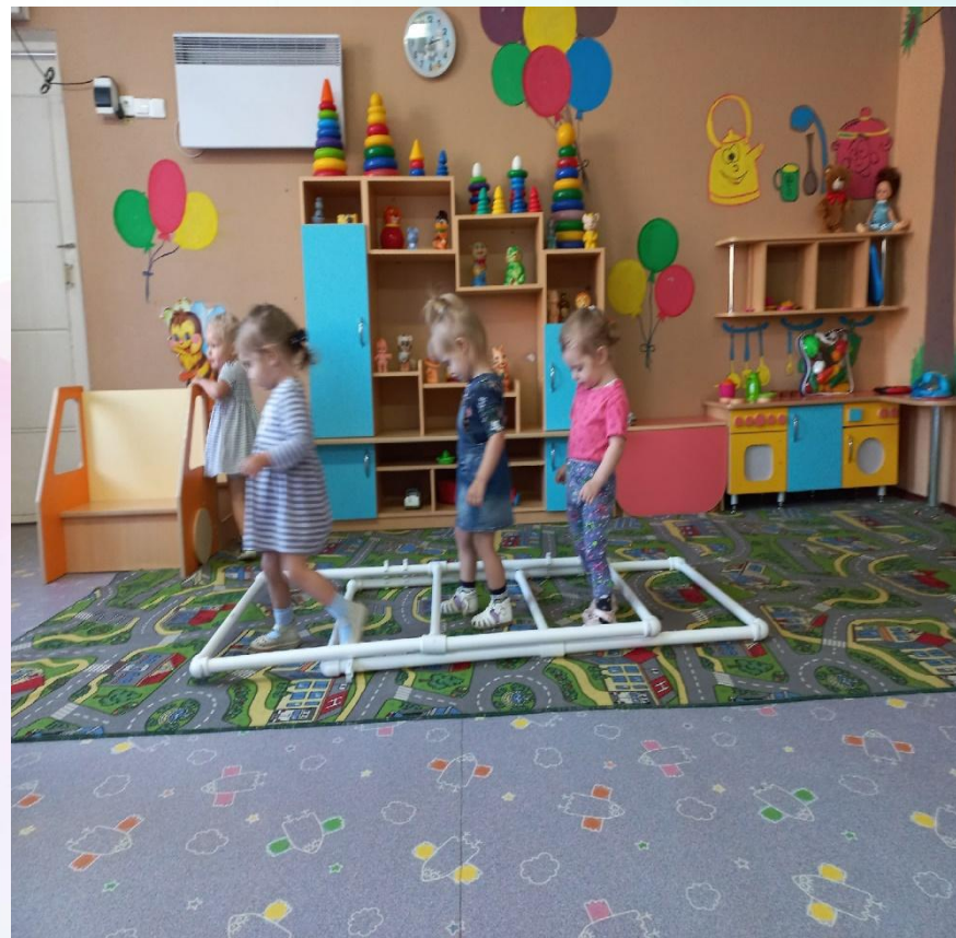
Перешагивание, бег, прыжки.