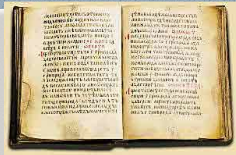
Русская правда. Рукопись XIV в.

Чтобы суды одинаково и справедливо судили, он велел собрать все законы и права в одну книгу, ставшую сборником всех письменных законов на славянском языке и назвал ее «Русская Правда».