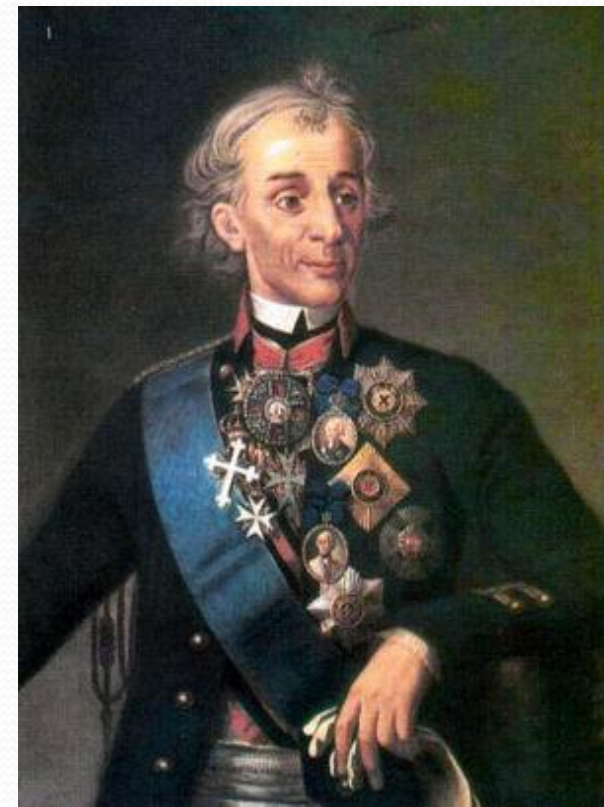
Суворов Александр Васильевич