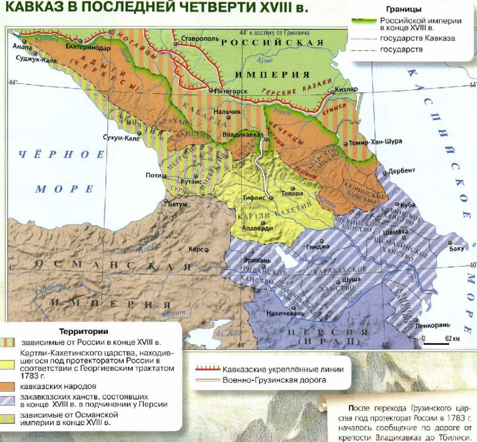
КАВКАЗ В ПОСЛЕДНЕЙ ЧЕТВЕРТИ XVIII в.

Восточная Грузия попала под покровительство России