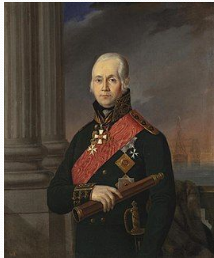
Ф. Ф. Ушаков