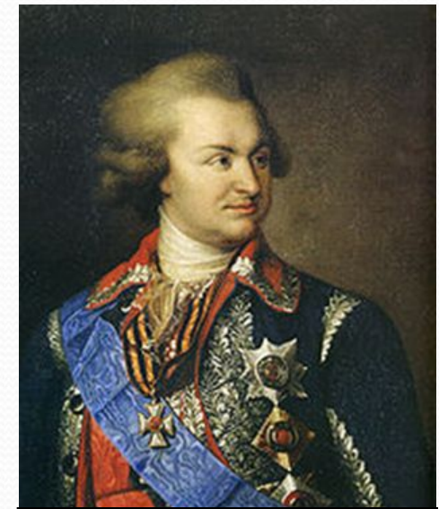
Г. А. Потёмкин