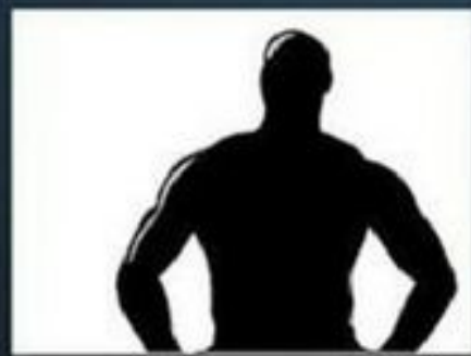
1-ЫЙ СРЕДНИЙ ПЛАН