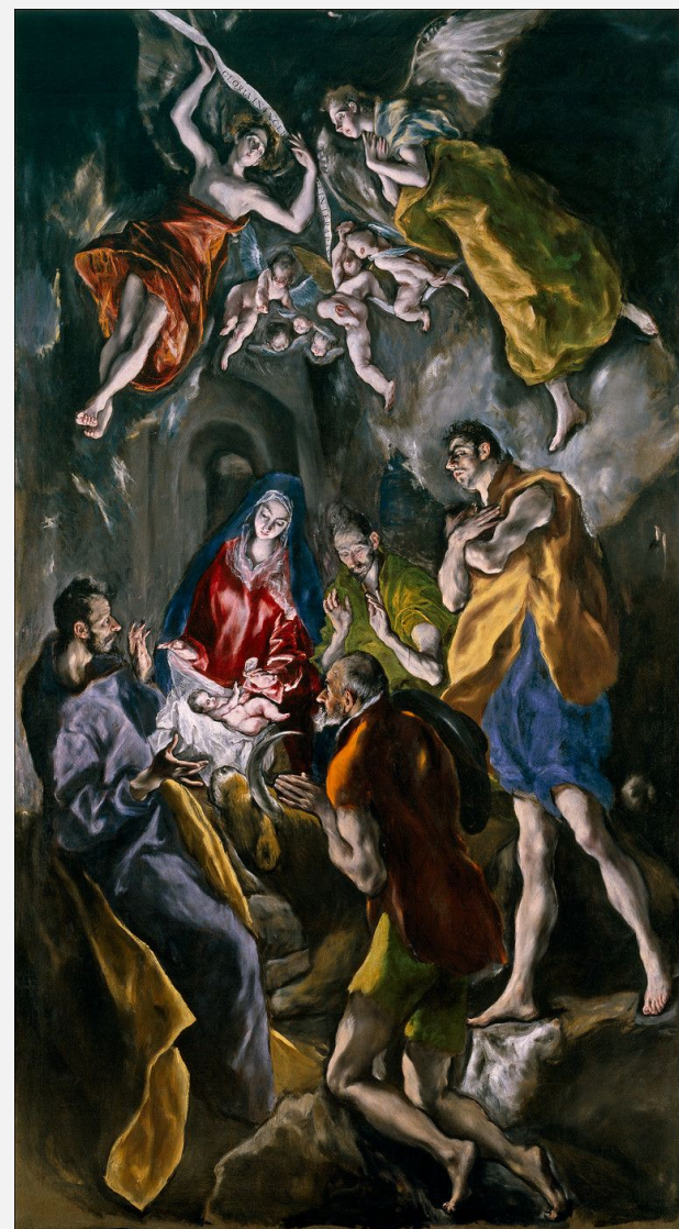
«Поклонение пастухов» 1612-1614