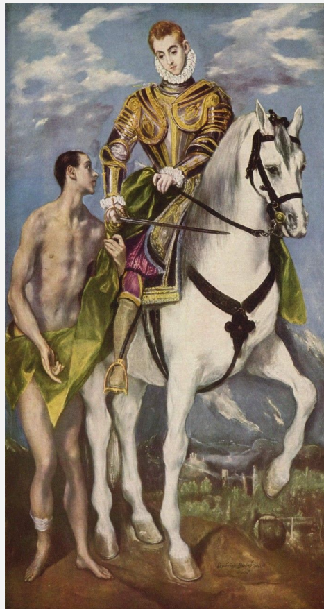
«Святой Мартин и нищий» 1597-1599