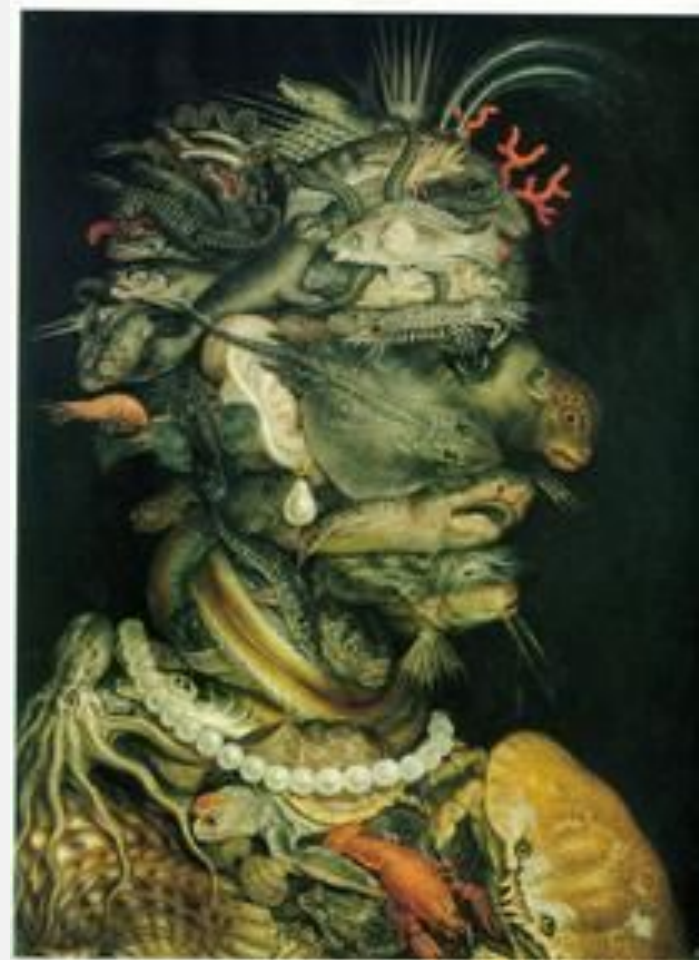
Джузеппе Арчимбольдо «Вода» (из цикла «стихии») 1566