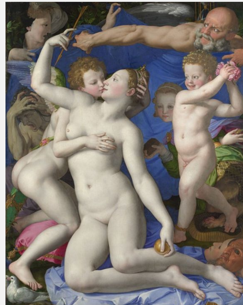
Аньоло Бронзино «Аллегория с Венерой и Амуром» 1546