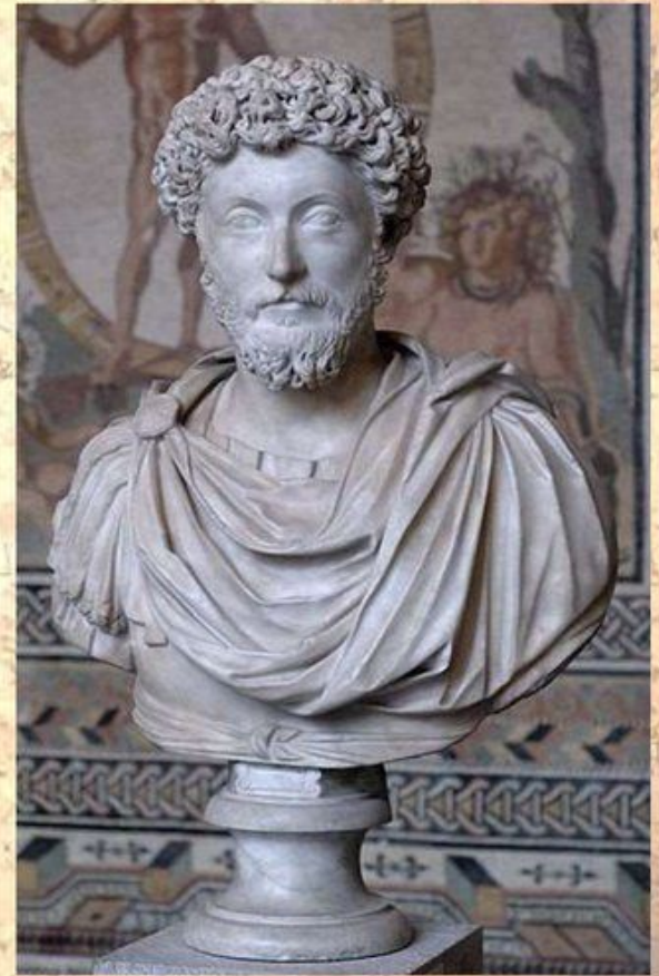
Римский император Марк Аврелий (121 – 180)