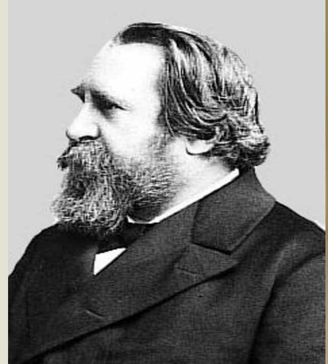
Теодор Мейнерт (1833 – 1892)