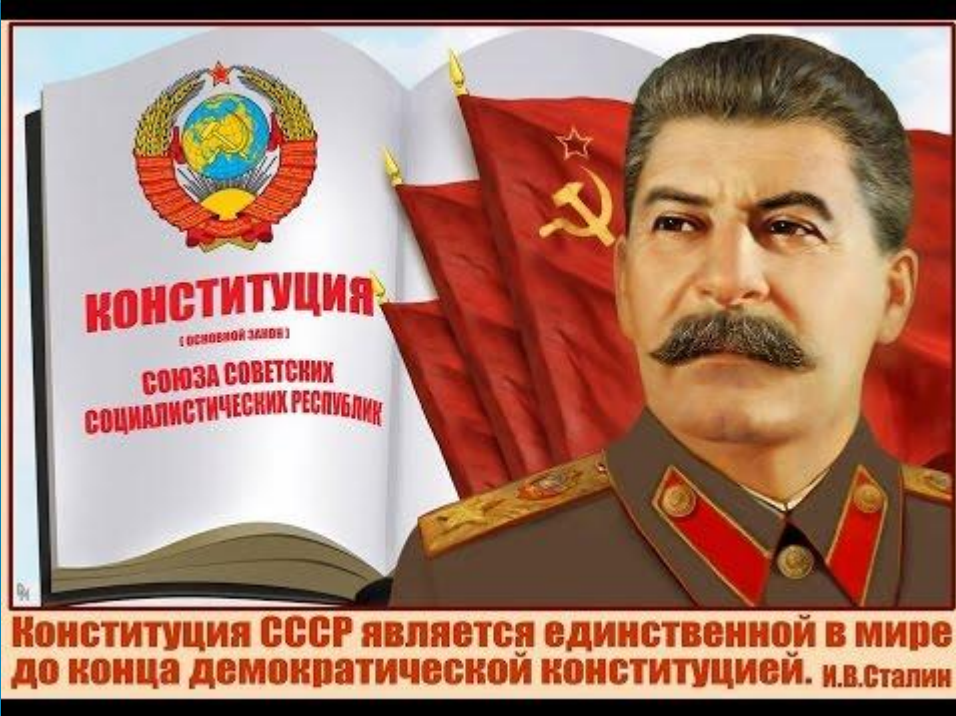
Конституция СССР является единственной в мире до конца демократической конституцией. И.В.Сталин