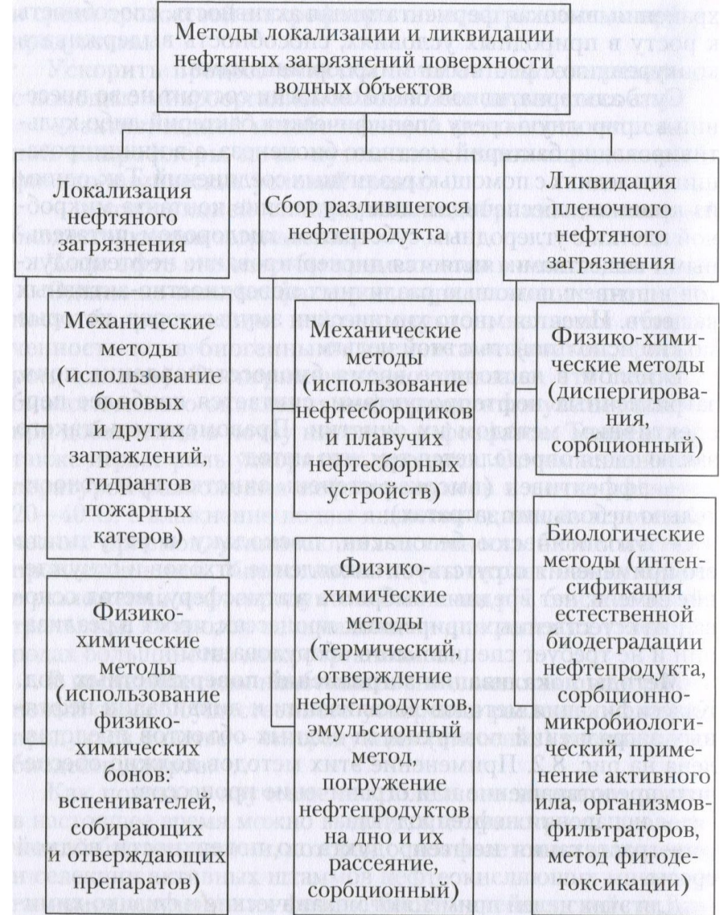
Рис. 8.2. Классификация методов локализации и ликвидации нефтяных загрязнений поверхности водных объектов