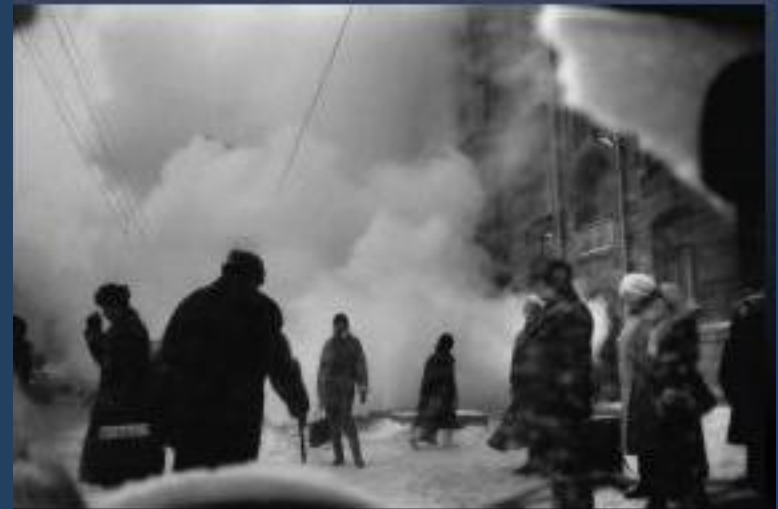
СССР, Москва, 1991

Работа в СССР. Работать в Советском Союзе репортажным фотографом было очень непросто. Во-первых, сами люди относились с подозрением и опаской к человеку с камерой в руках. Во-вторых, милиция могла попросту засветить нежелательные кадры. Тем не менее Георгий Пинхасов продолжал снимать, его наследие - тысячи колоритных фотографий, ярко передающих эпоху СССР. Сам Пинхасов Георгий в одном из интервью сказал, что благодаря Тарковскому увидел мир другими глазами. Фотограф с восхищением говорит о встречах с великими людьми - Картье Брессоном, Надеждой Мандельштам, их простоте и любви к познанию. Считает, что их нежелание возвышаться над другими послужило ему примером в творчестве и жизни.