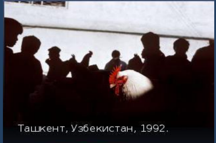
Ташкент, Узбекистан, 1992.