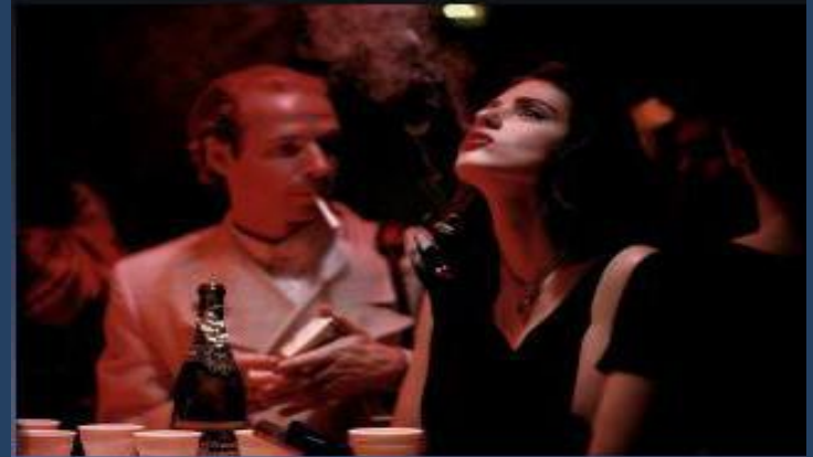
Ночной клуб, Москва, 1993.