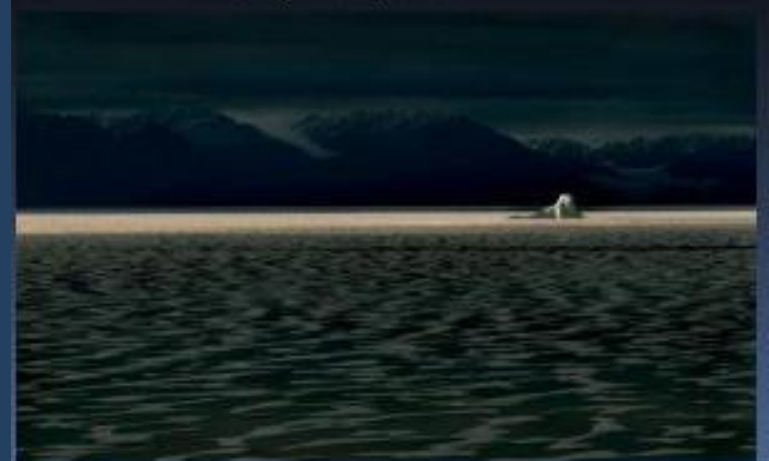
Баффинова Земля, Канада, 2005.