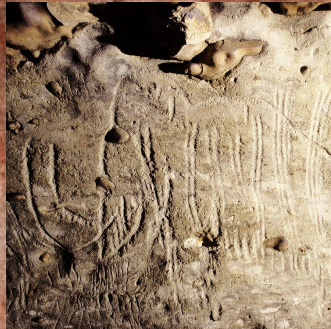
МАКАРОНЫ – отпечатки рук.

Живопись родилась практически одновременно с появлением самого человечества. Пещерный человек обрел способность ходить прямо, использовать орудия труда и обустроить для себя элементарное жилище. Вместе с этим он почувствовал потребность изображать окружающий мир. Первые рисунки были созданы примерно 30 000 – 10 000 лет до н.э. Их нашли археологи в пещерах на Юге Франции и в Испании.