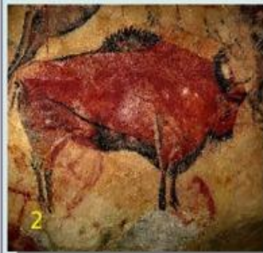
Группа 2. Изображения выполненные природными красками (фреска).