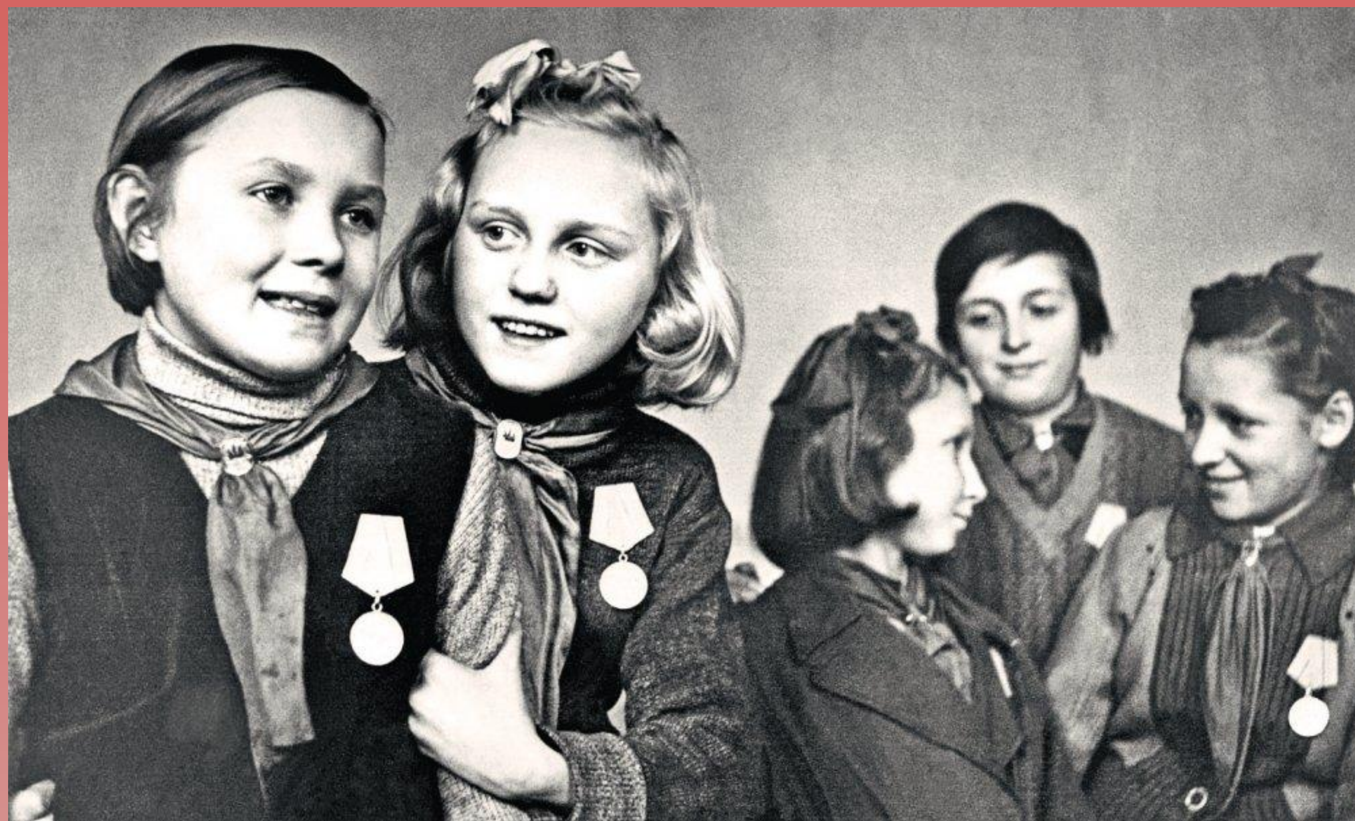
Отличницы 4-го класса 47-й школы г. Ленинграда, награжденные медалями «За оборону Ленинграда». Ноябрь 1943 г.

«За доблестный труд в Великой Отечественной войне 1941–1945 гг.».