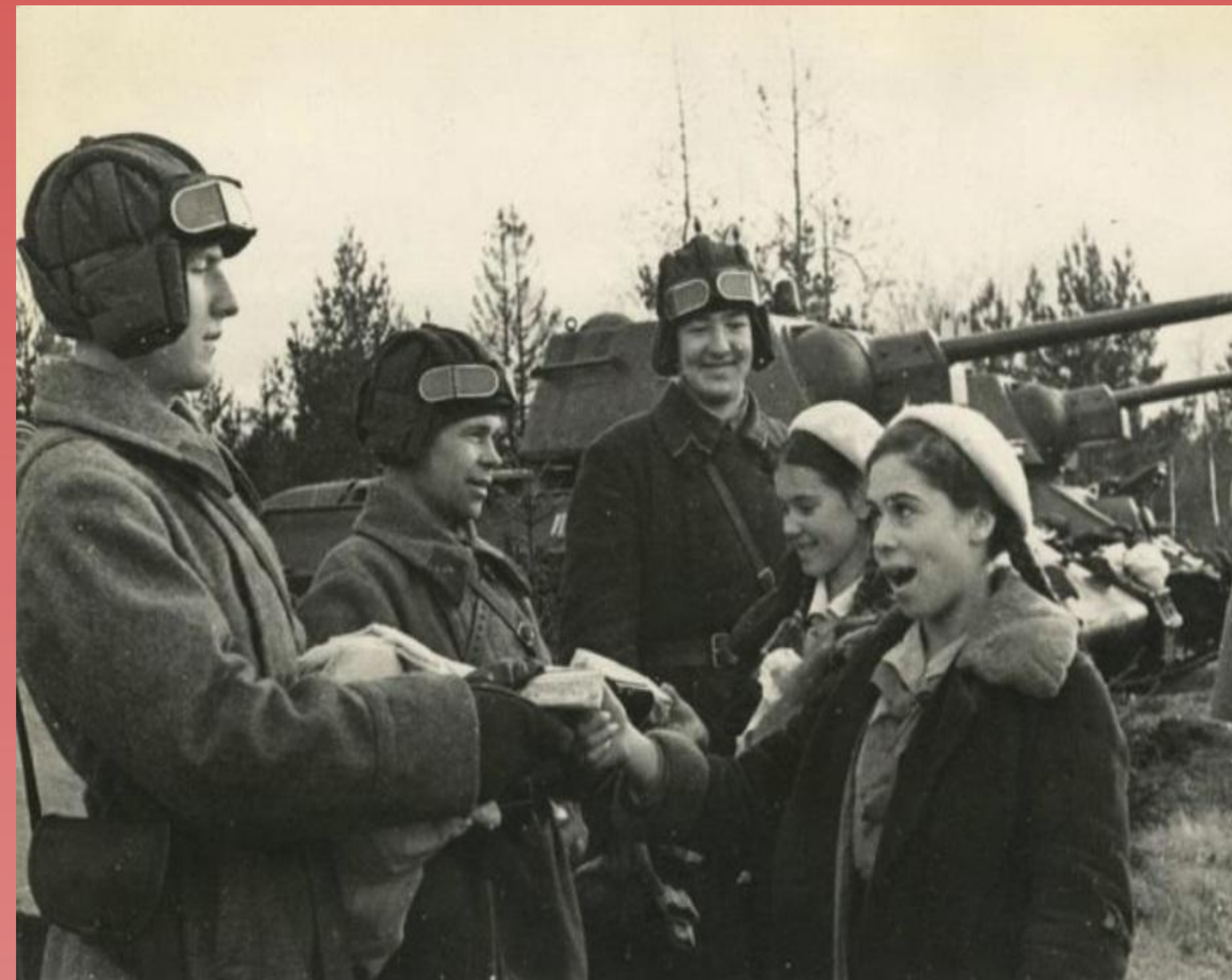
Передача танка «Ташкентский пионер»

С 1942 года на фронтах громили фашистов танки «Горьковский пионер» , «Московский пионер» , «Пионер Башкирии» , «Ташкентский пионер» , «Школьник Свердловска» и др. Пионеры сами рали, шили и вязали теплые вещи для фронтовиков, отправляли на фронт подарки.