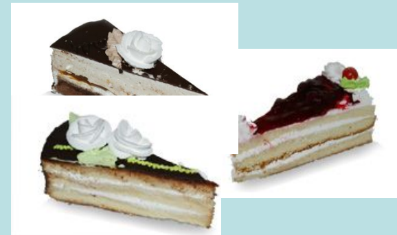
three pieces of cake