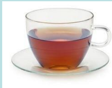
a cup of tea