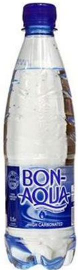
a bottle of water