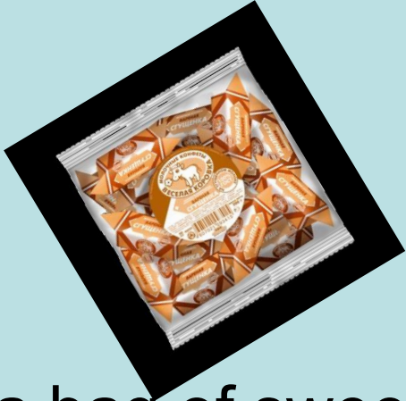
a bag of sweets