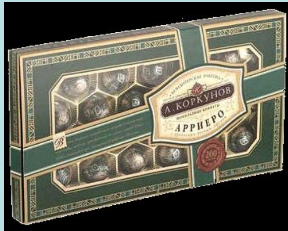
a box of chocolates