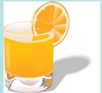
a glass of orange juice