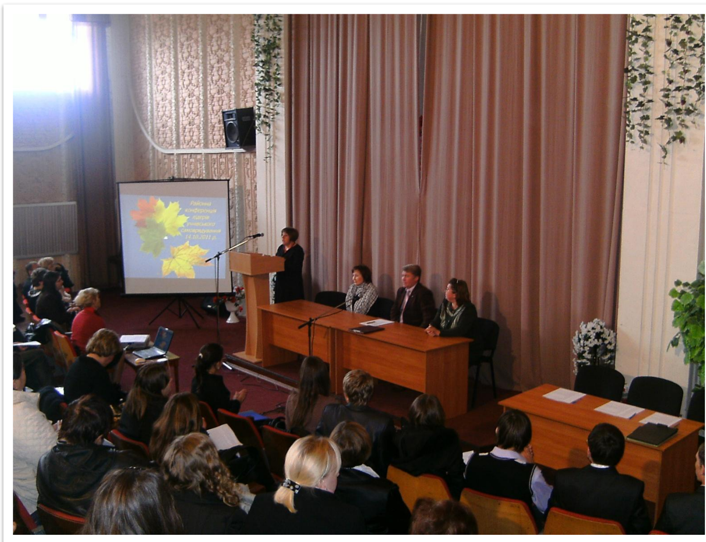
Участь в засіданнях сесій районної Ради депутатів