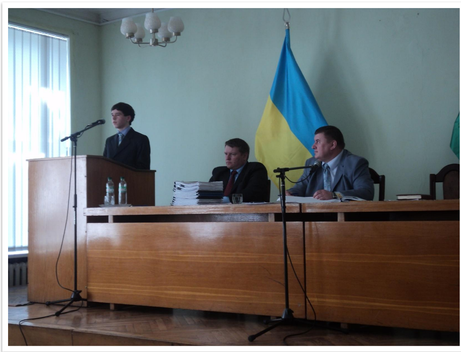
Районна учнівська конференція