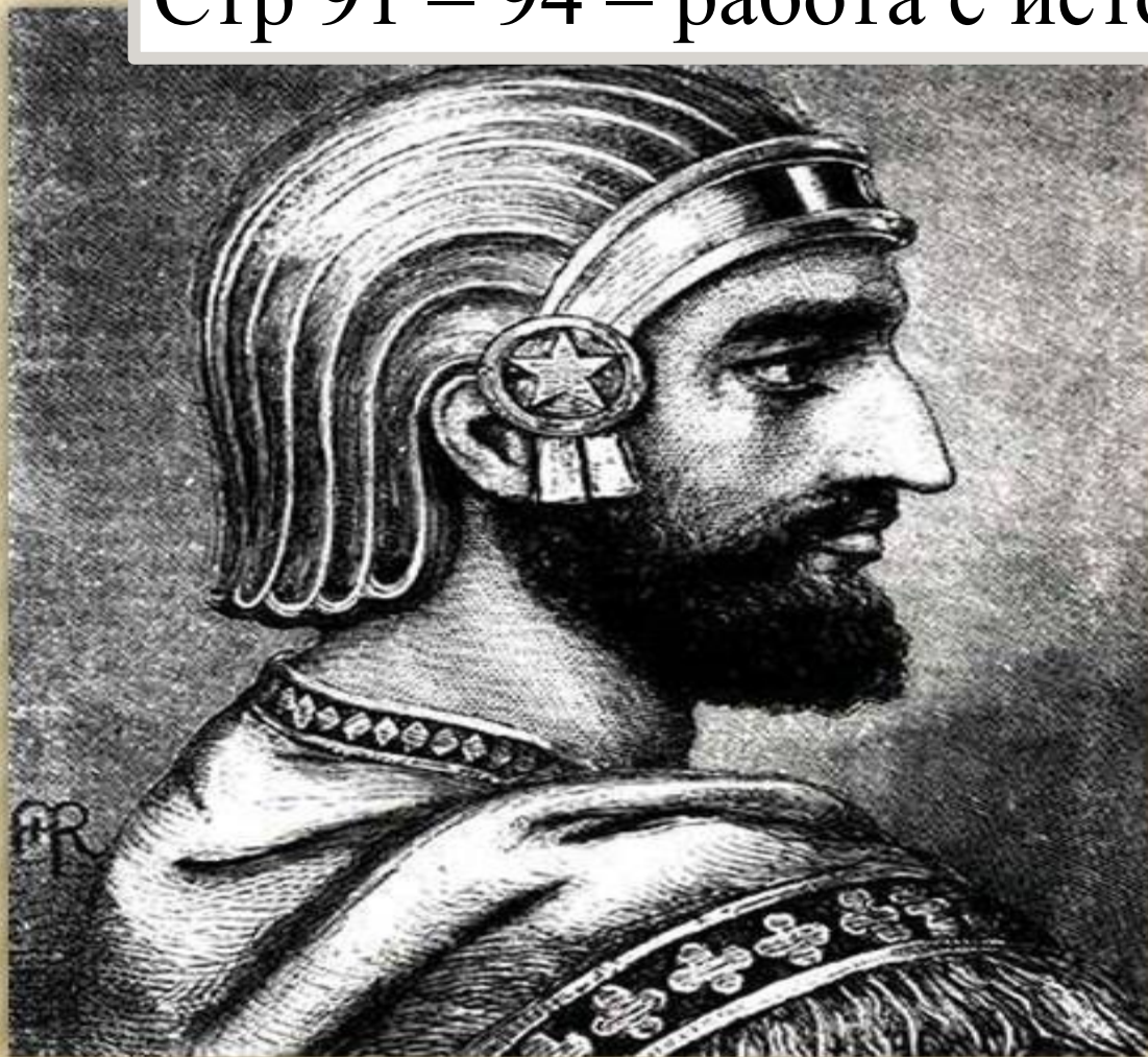
Кир Великий - основатель Персидской державы