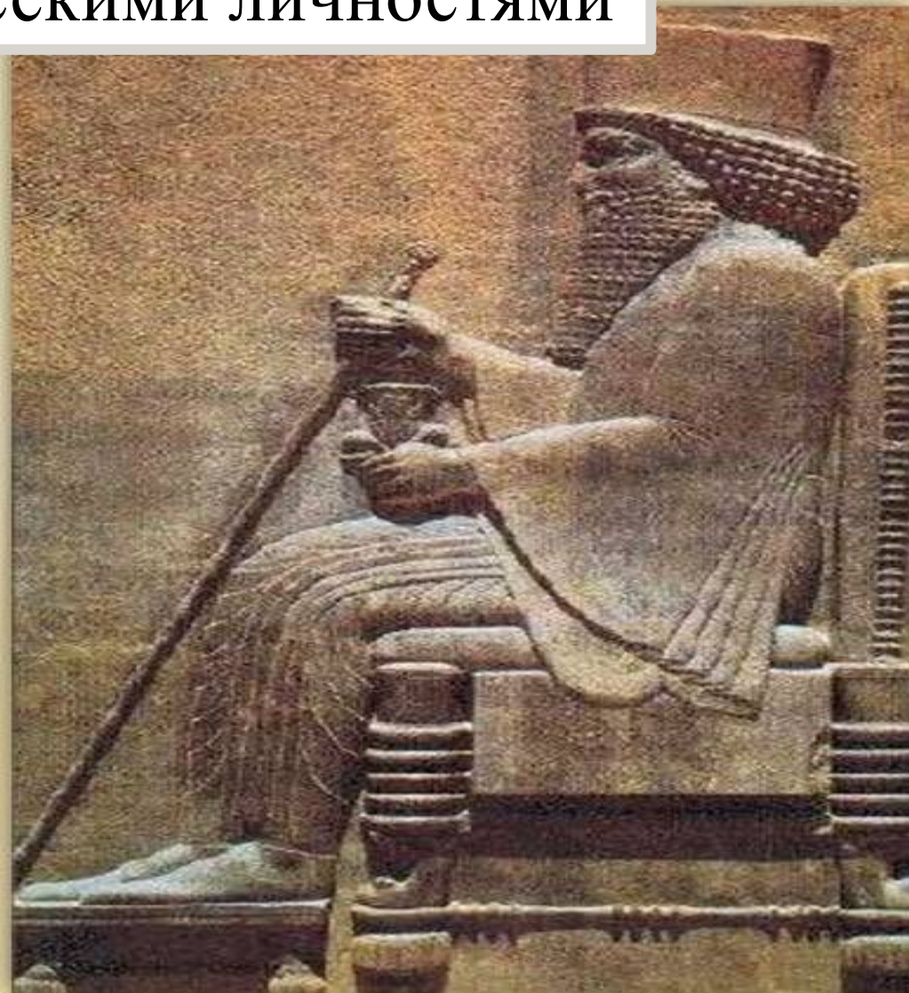
Дарий I – самый могущественный правитель Персии