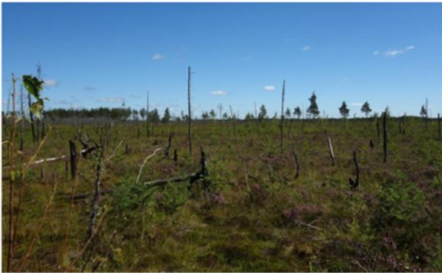
Болото Кущёвское около ст. Лейпясун (Лен.область)