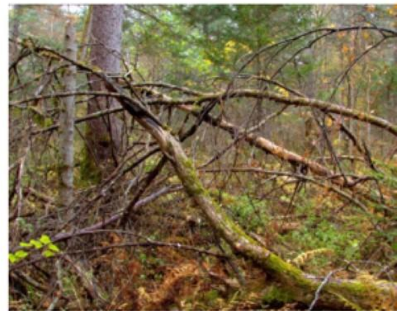
Типичные завалы в смешанном лесу