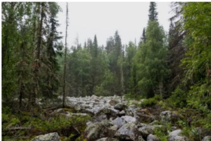
Северный Урал. Курумник в лесу