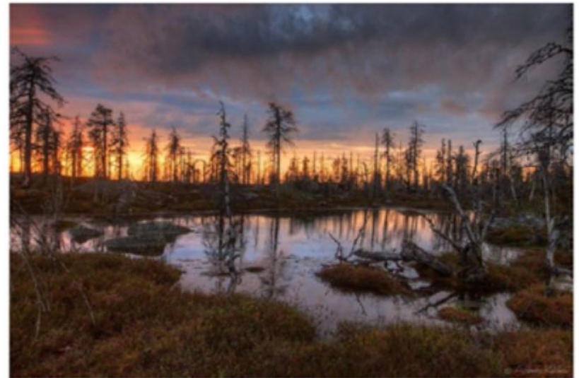
Болото на горе Воттоваара (Карелия)