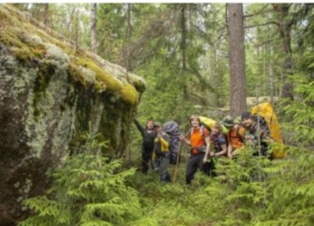
Злынский лес около Выборга