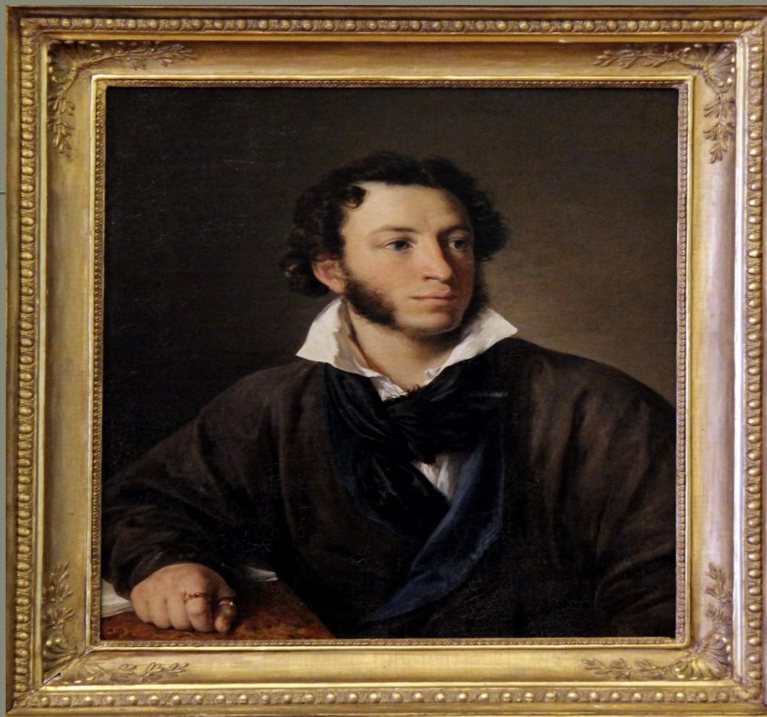
Александр Сергеевич Пушкин (1799 – 1837)