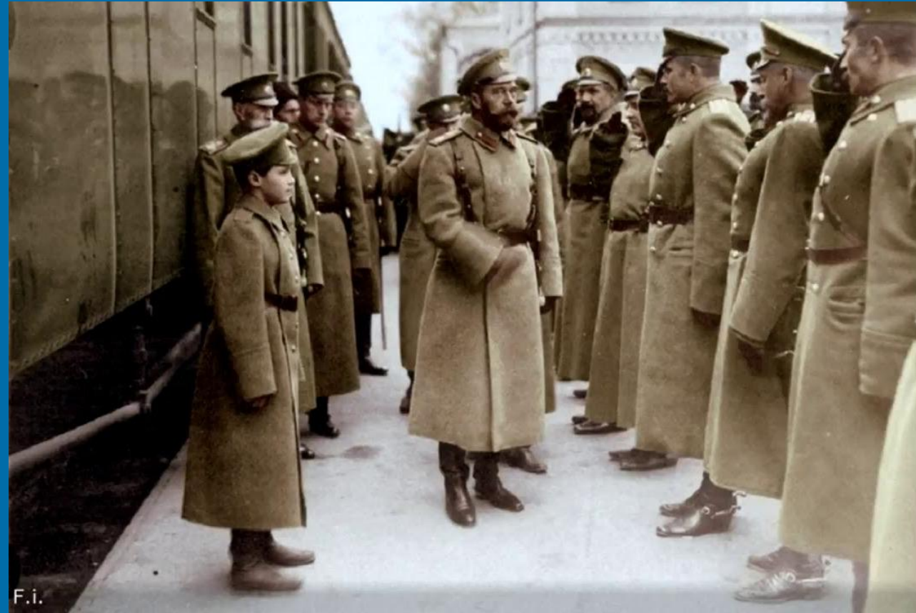
Император Николай Второй с сыном Алексеем прибывает в Ставку. Фото времён Первой Мировой войны