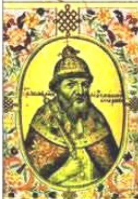
Царь Иван Грозный