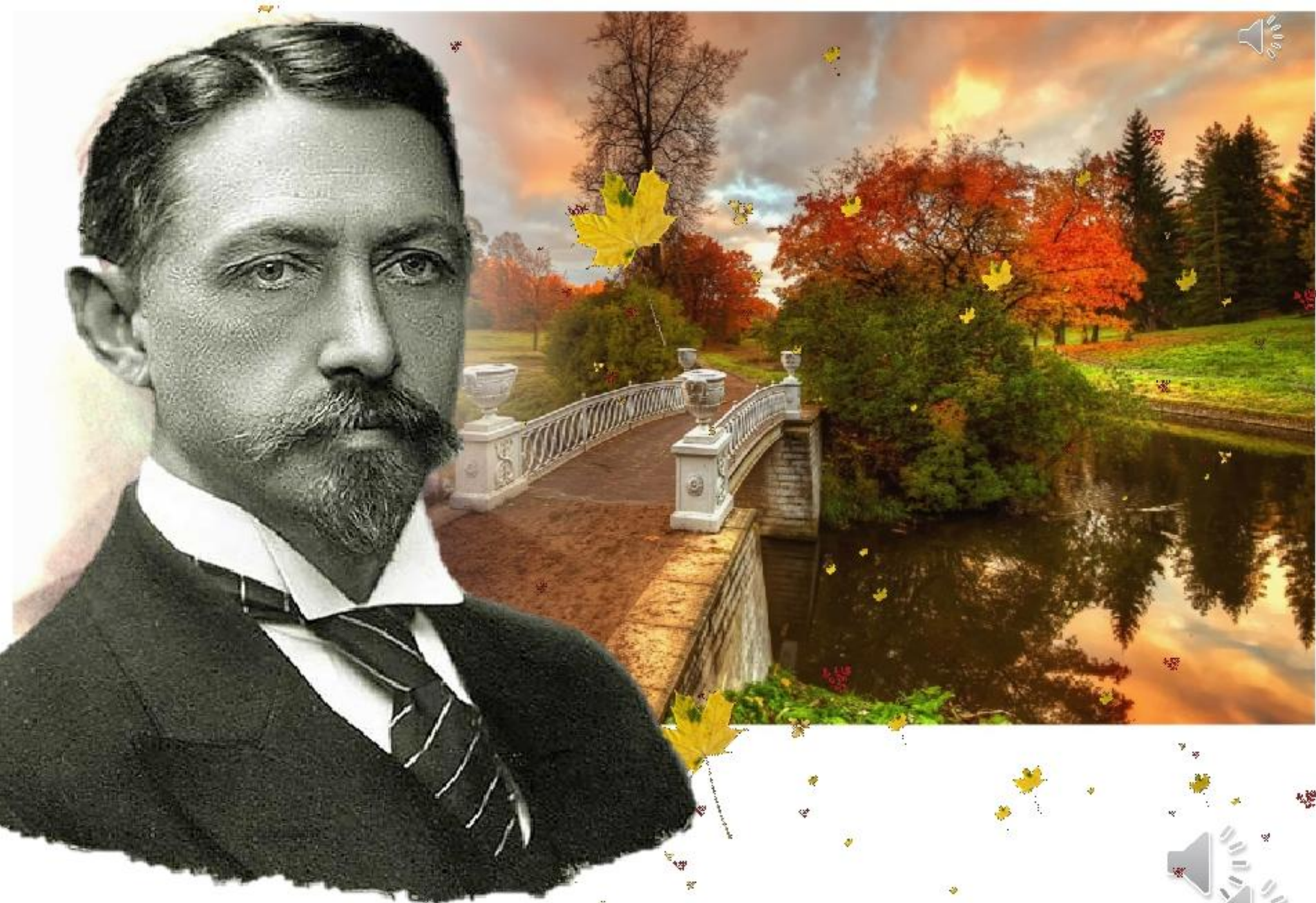
Иван Алексеевич Бунин