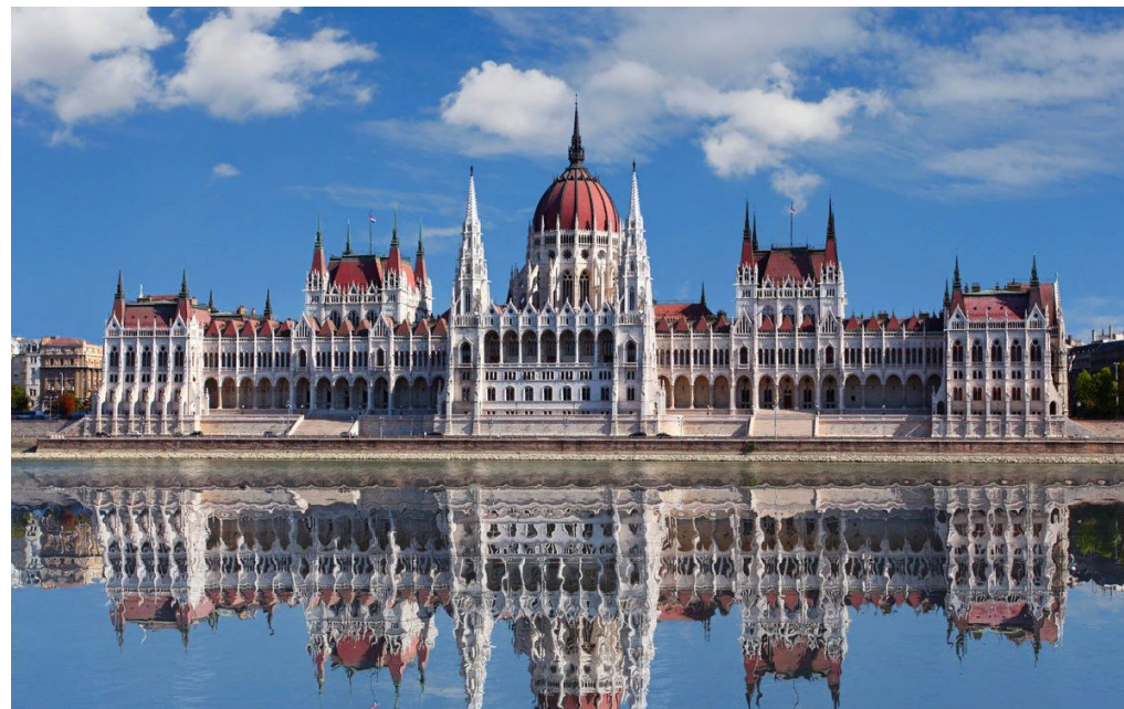
Здание Парламента в Будапеште

Парламентаризм не может существовать без парламента, его основой является именно сильный и полномочный парламента. Но парламентаризм есть в то же время высшее качество парламента, которое может им утратиться. Парламент может существовать без существенных элементов парламентаризма, что характерно для авторитарных режимов.