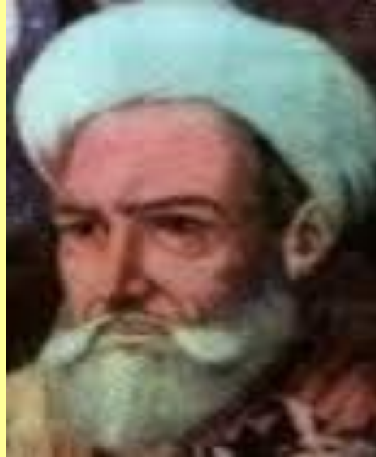
Мирза Абдулкадир Бедиль