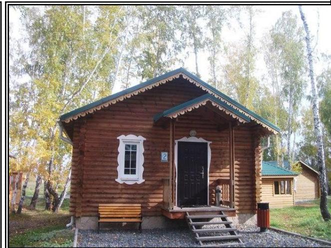
Рисунок 14 - домик вид снаружи