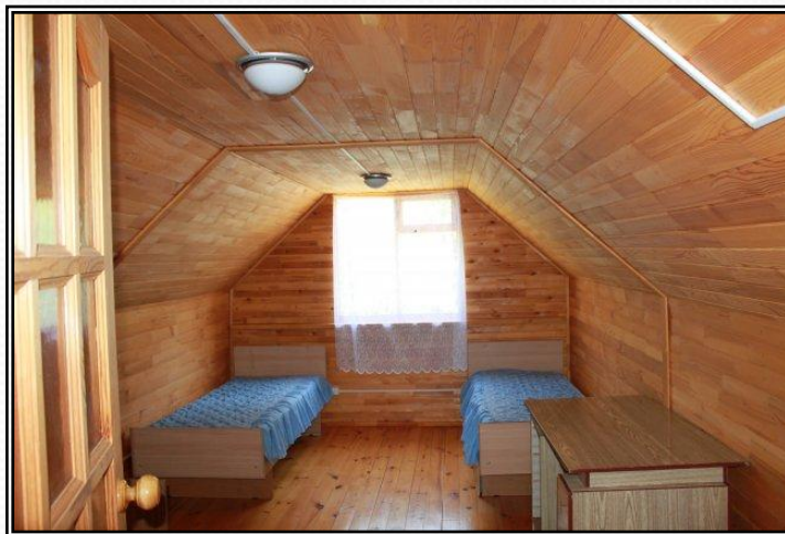
Рисунок 6 - Спальные места