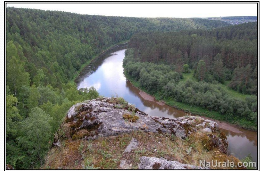
Рисунок 3 - Река Уфа (широколиственный бор)