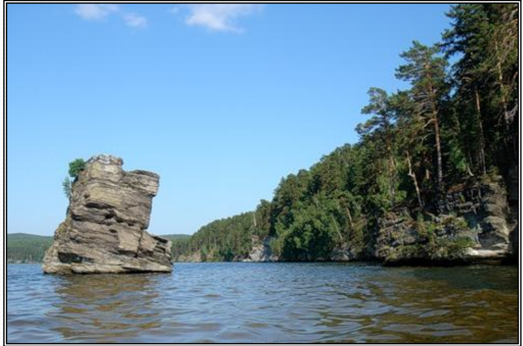
Рисунок 5 - Озеро Иткуль «Шайтан-камень»

Озеро Иткуль расположено на севере Челябинской обл. и является памятником природы. Длина его 8 км, ширина 6 километров. Максимальная глубина 16 м, средняя 8 м. Прозрачность воды 4 м. Вода пресная. Дно илистое, песчаное, не ровное. Озеро окружено лесистыми холмами, местами у воды встречаются каменистые мысы. Восточный берег каменистый, обрывистый. Западный берег пологий. На южном берегу выступает знаменитый "Шайтан-камень". В озеро впадает 8 речек. Единственный исток, река Исток, течет в озеро Синара. На западном берегу озера довольно много баз отдыха.