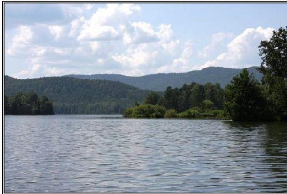
Рисунок 8 - Озеро Сунгуль