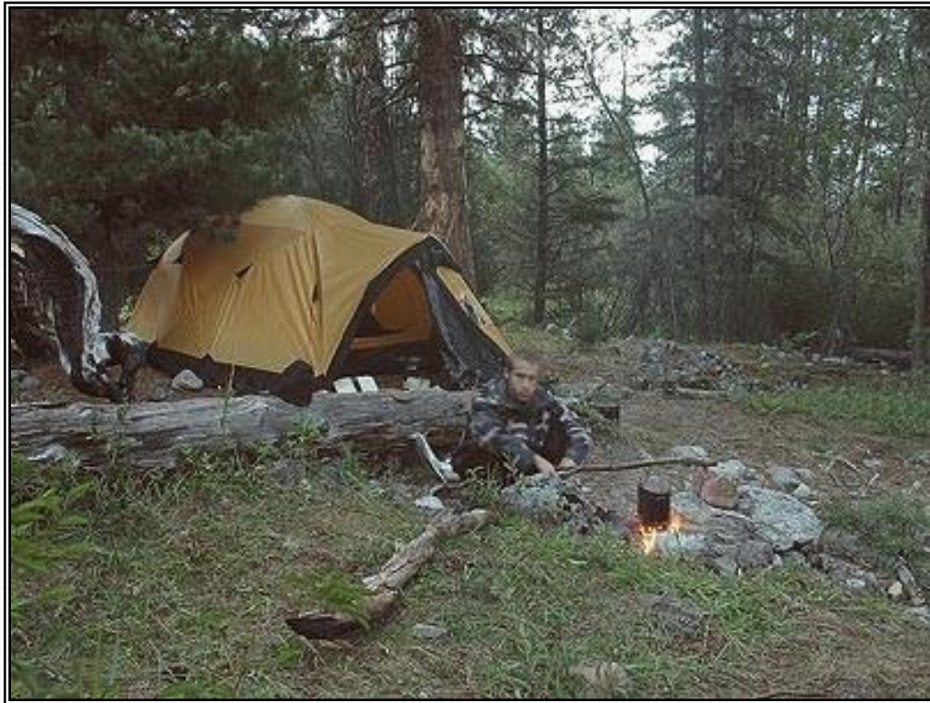
Рисунок 4 - Палатка 4-х местная