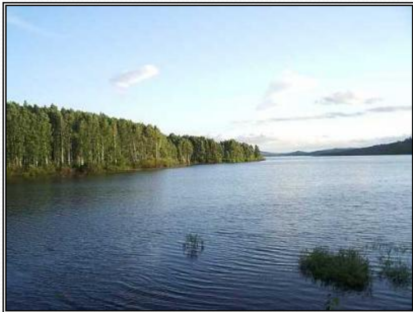
Рисунок 11 - Озеро Калды

Озеро Калды промысловое. Диаметр озера около 4,5 км. Максимальная глубина 7 м. Вода пресная и очень прозрачная. Дно, как и берег, песчаное, и только местами встречается камыш и ил. Юго-западный берег в лесу. Здесь же много баз отдыха.