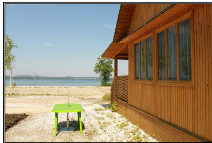
Рисунок 7 - Дом вид снаружи