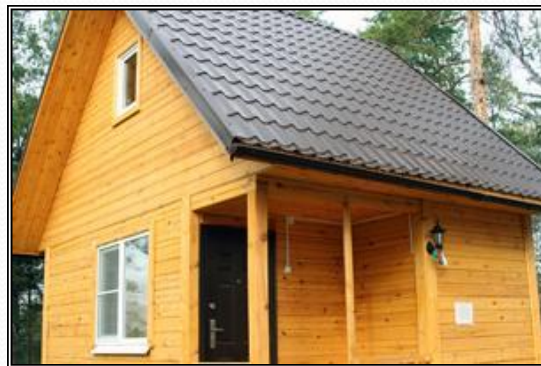
Рисунок 10 - Летний домик