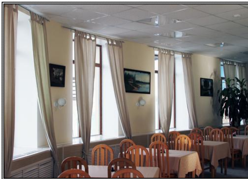
Рисунок 9 - Ресторан «Ветерок»