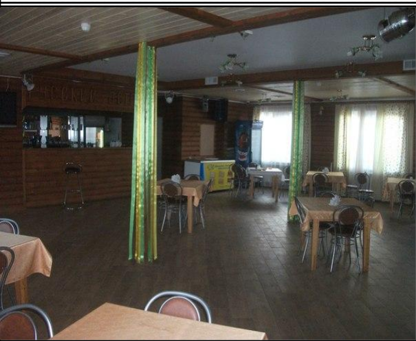
Рисунок 12 - кафе базы отдыха «Русский остров»

Стоимость размещения 4 человек на Базе отдыха «Русский остров» будет составлять от 4000 до 5000 р., в зависимости от дня недели. В стоимость включен завтрак. Обед стоит 250 р./чел., доставка в домик. Заезд на озеро стоит 300 р. с машины.