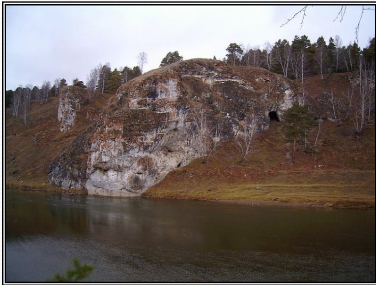
Рисунок 2 - Река Уфа. Памятник природы на участке между Тимофеевым и Зайкиным камнями (окрестности дер. Арасланово)