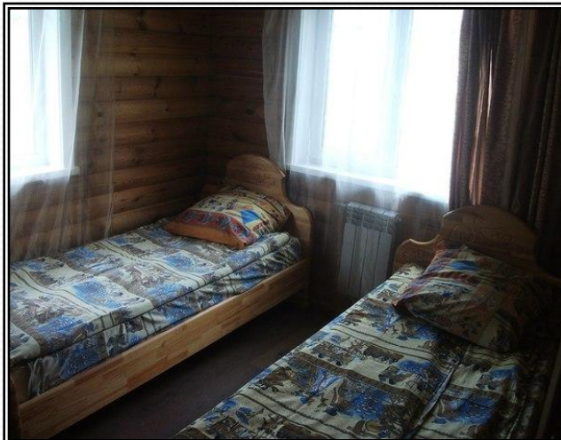
Рисунок 13 - домик вид внутри