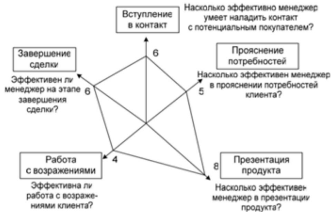
Рис. 7. Модель тренинга эффективных продаж