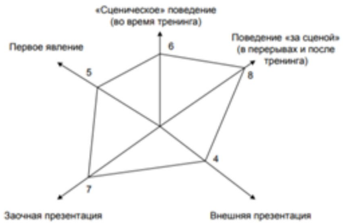
Рис. 9. Модель тренинга «Имидж тренера»