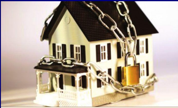
Proprietarii tin la preturile ridicate ale caselor, dar cumparatorii nu mai sunt dispusi sa le accepte, ceea ce a dus la oprirea vanzarilor