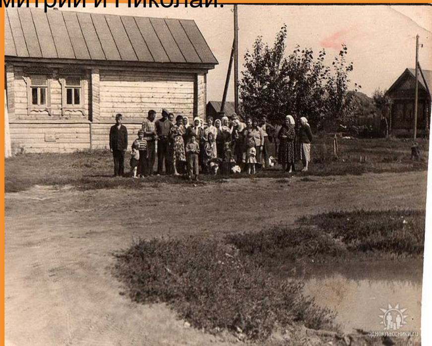
Жители села Ульяново.