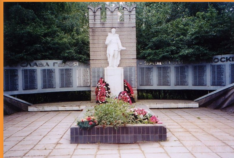
Обелиск павшим воинам.