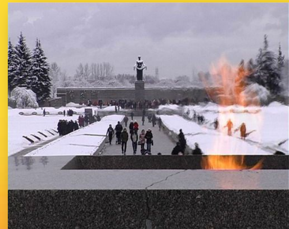
Обелиск павшим воинам. г. Мцанск