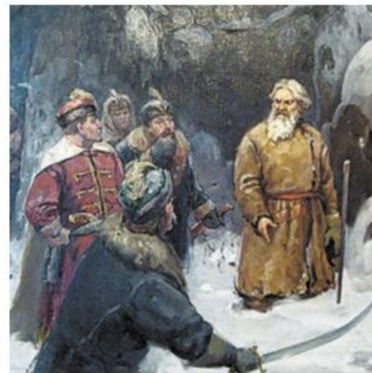
Сусанин Иван Осипович