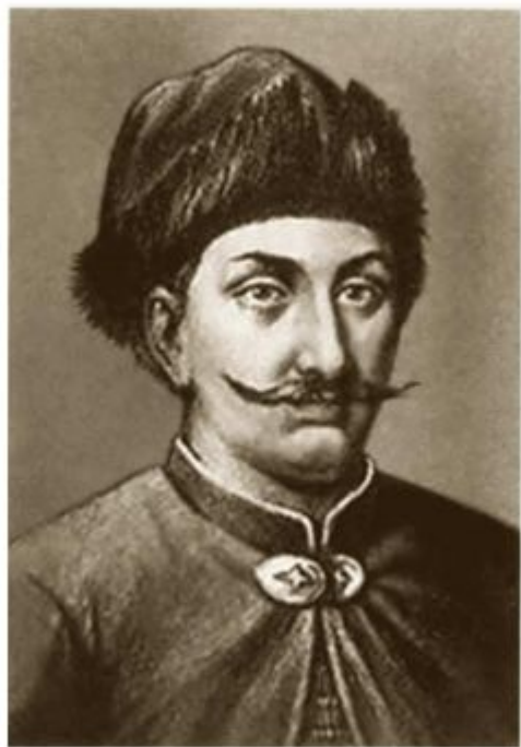
Ляпунов Прокопий Петрович