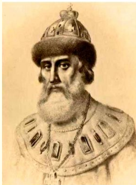
Шуйский Василий Иванович