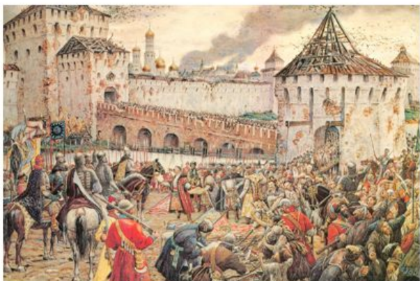
Ополчение во главе с Мининым и Пожарским взяло Китай-Город

Какое историческое событие произошло 4 ноября (22 октября по старому стилю) 1612 года?