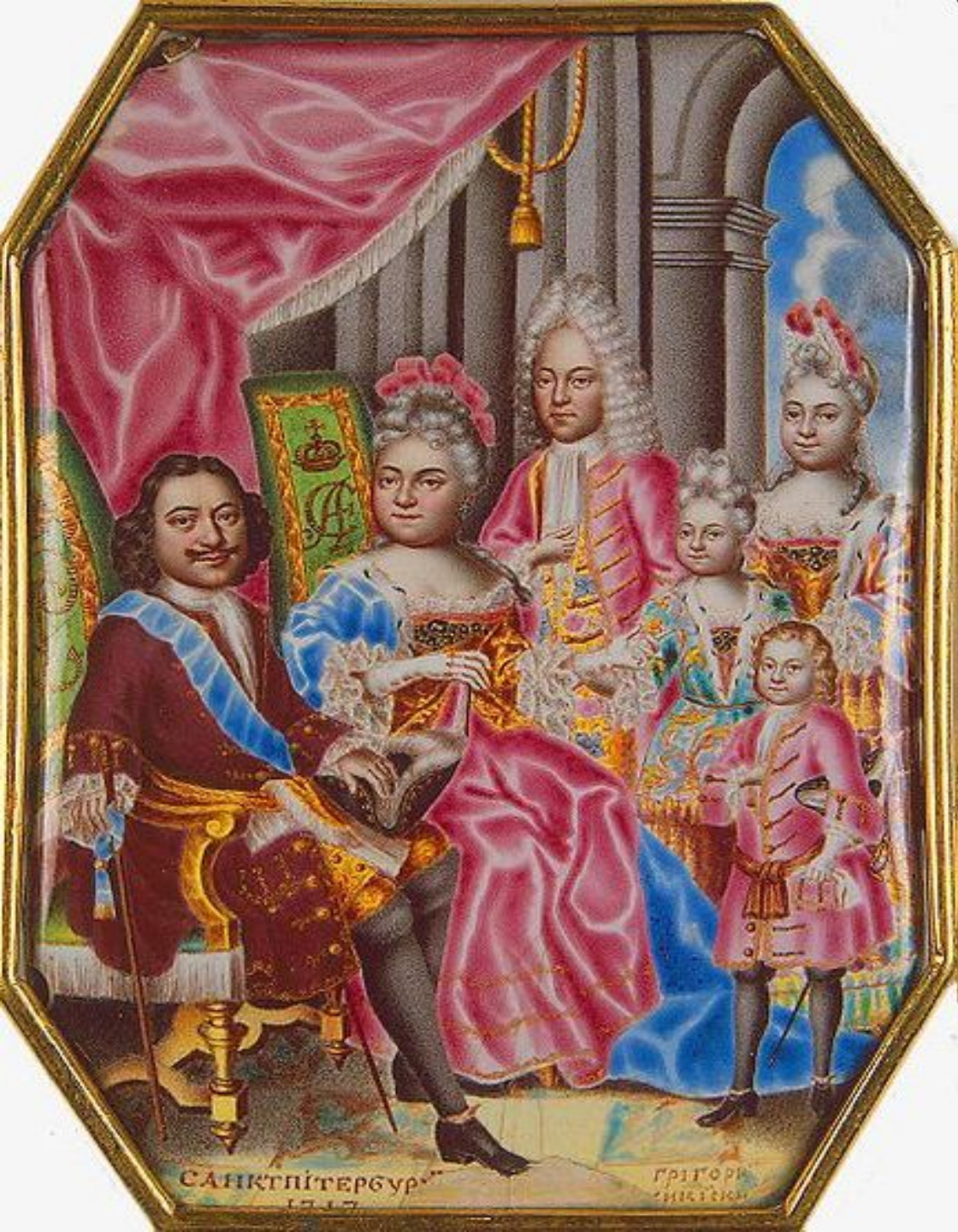
Семья Петра I в 1717: жена - Екатерина I, старший сын Павел, младший сын Пётр и дочери Анна и Елизавета.