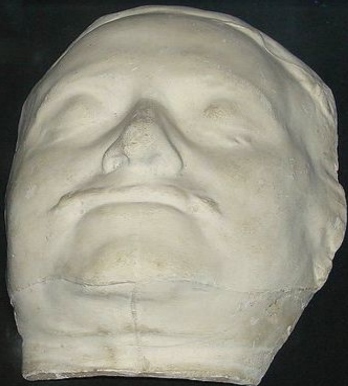
Б. К. Растрелли. Маска посмертная Петра I. Гипс, 1725 г. Копия.