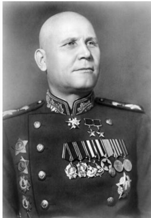
Генерал И.С.Конеv - командующий Западным фронтом