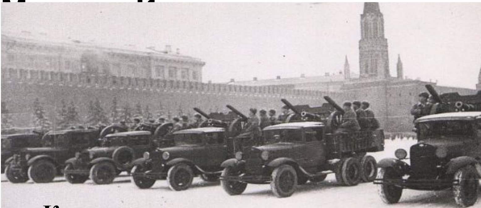
Москва, Красная площадь. Парад 7 ноября 1941 г.