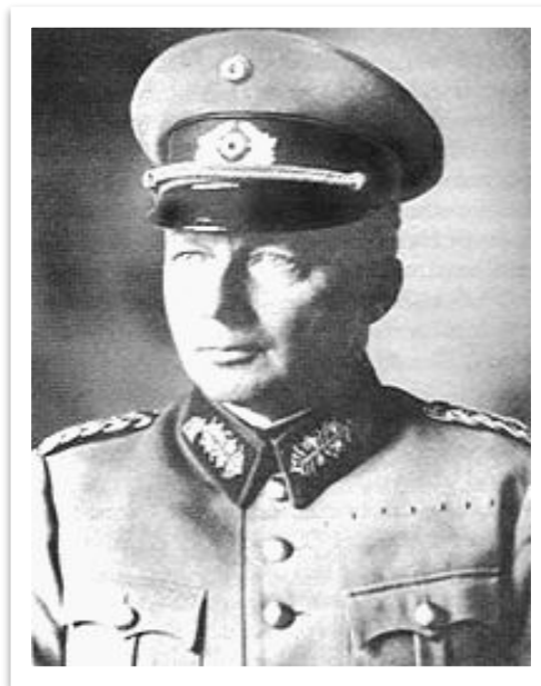
фон Клюге – командующий 4 танковой армией