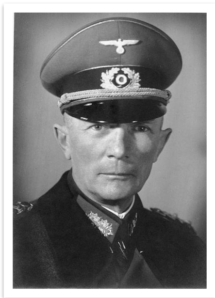
Фёдор фон Бок – командующий группой армий «ЦЕНТР»