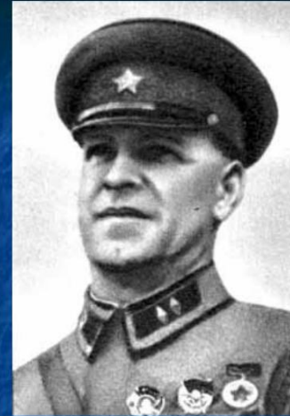
Командующий Западным фронтом Г.К. Жуков во время битвы за Москву.