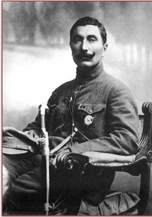
Генерал Буденный С.М. командующий Резервным фронтом