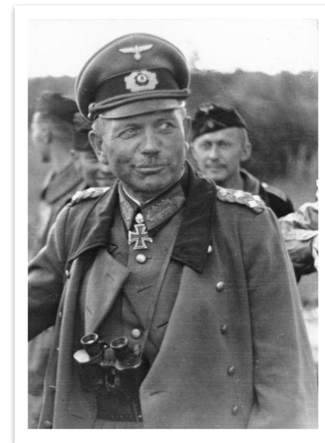
Г. Гудериан - командующий 2 –й танковой армией