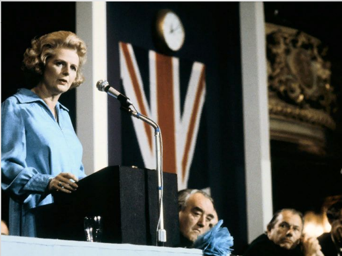
Маргарет Тэтчер произносит свою первую речь в качестве лидера партии на конференции консерваторов, 1 октября 1975 год