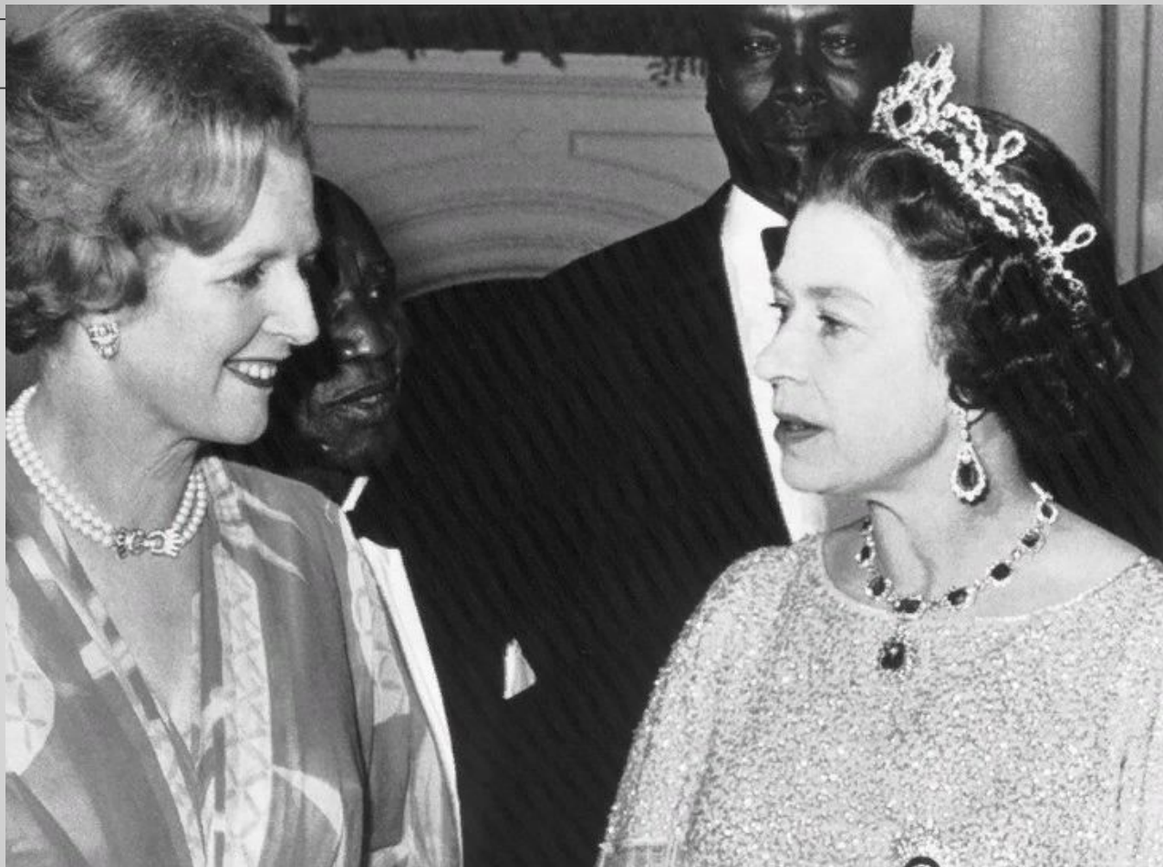
С королевой Елизаветой