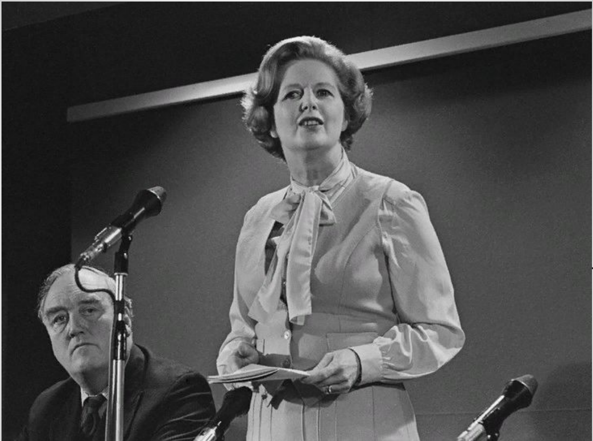
Маргарет произносит речь в рамках своей предвыборной кампании, 11 апреля 1979 года. Меньше, чем через месяц, она станет первой женщиной премьер-министром Великобритании