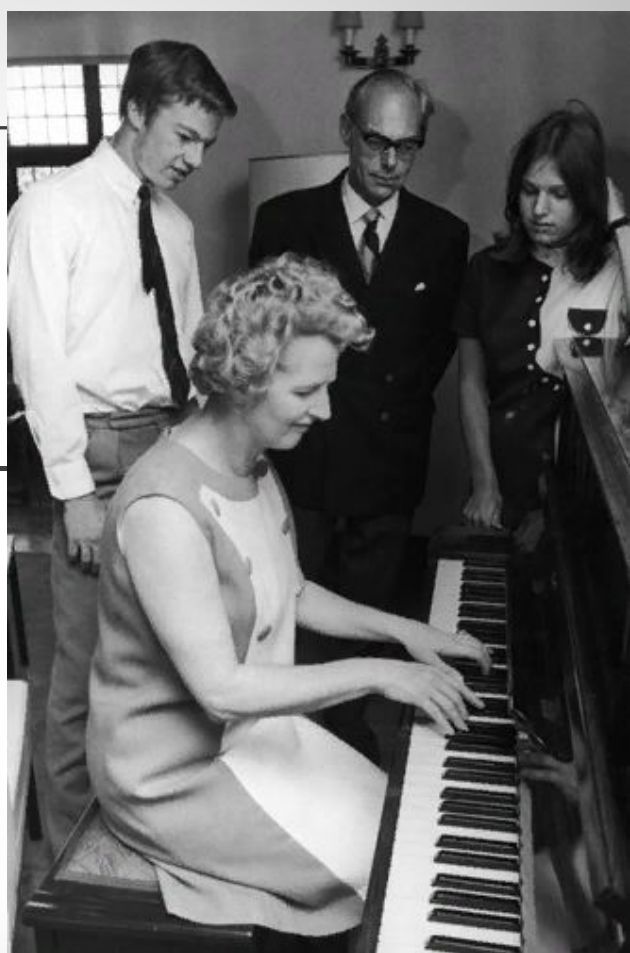
Семья Тэтчер: Маргарет, ее муж Дэнис и их близнецы Марк и Кэрол, 1970 год