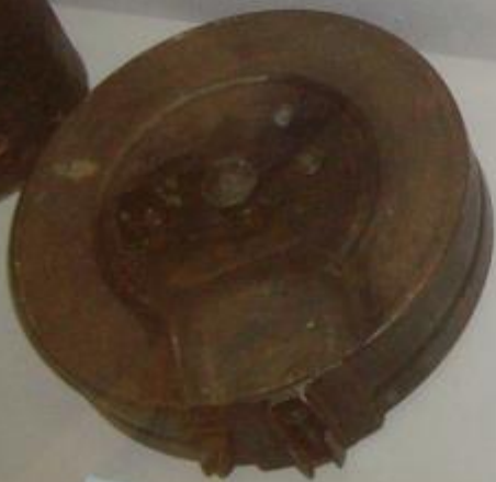
ДИСК ОТ АВТОМАТА ДВИЖЕНИЯ