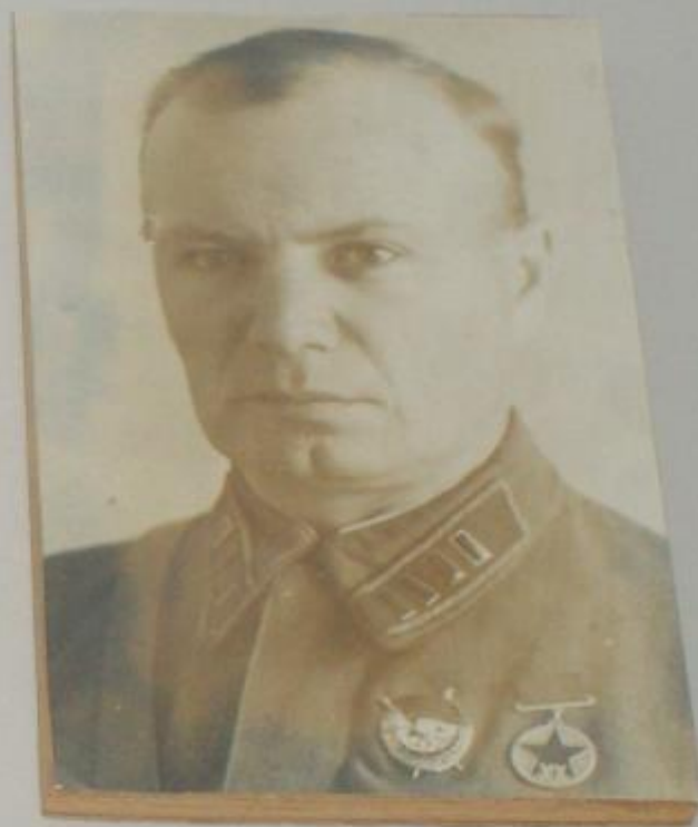
ФОТОПОРТРЕТ И ПОГОНЫ КОМАНДИРА 352-й СТРЕЛКОВОЙ ДИВИЗИИ Ю.М.ПРОКОФЬЕВА.