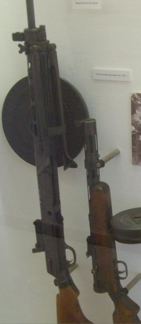
Thompson submachine gun, No. 1001