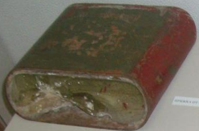
СМОНОВЫЙ БУКСИР ТАНКА