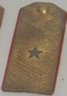
ФОТОКОПИЯ И ПОЛОНА КОМАНДИРА 152-й СТРЕЛКОВОЙ ДИВИЗИИ Ю.М. ПРОКОФЬЕВА