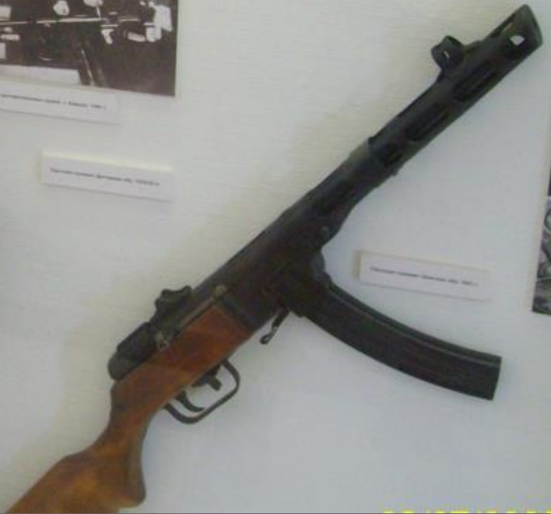
Thompson submachine gun, No. 1003