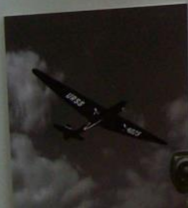
Самолет полковника Соловьева.