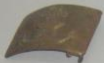
ОСКОЛОК ОТ РЕЙСА СОВЕТСКОГО ТАНКА