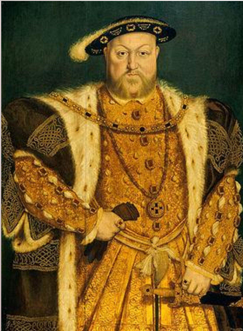
Генрих VIII (1491-1547)

Начало Реформации в Англии связано с именем Генриха VIII. Первоначально Генрих был противником Реформации, Однако за написанный труд король получил от Папы титул «защитник веры».