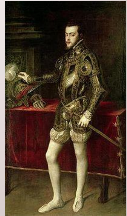
Муж Марии Кровавой Филипп II

Мария создала специальную комиссию для искоренения ереси, провела через парламент решение о восстановлении над Англией папской власти. По всей стране сжигали противников католицизма. Процветали шпионаж и доноительство. Марии удалось провести через парламент закон о частичном возвращении церкви её земель. Это привело к усилению недовольства католицизмом в стране.