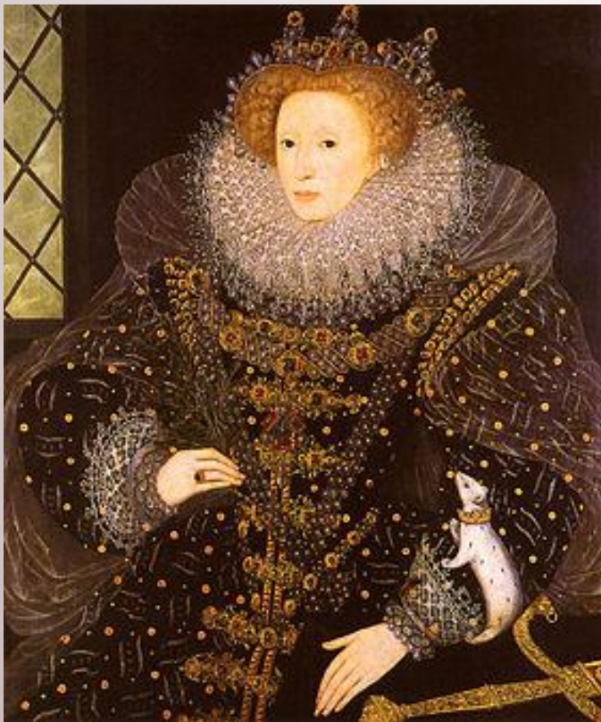
Елизавета I ( 1558-1603 гг.)

Королева обладала незаурядными личными качествами, силой воли, талантом государственного деятеля.