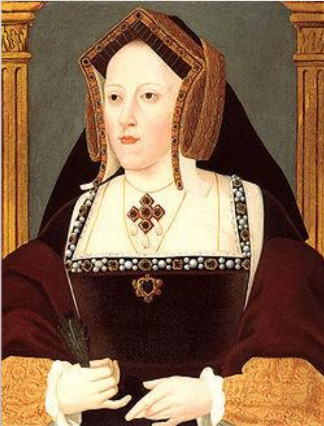
Екатерина Арагонская 1-ая жена