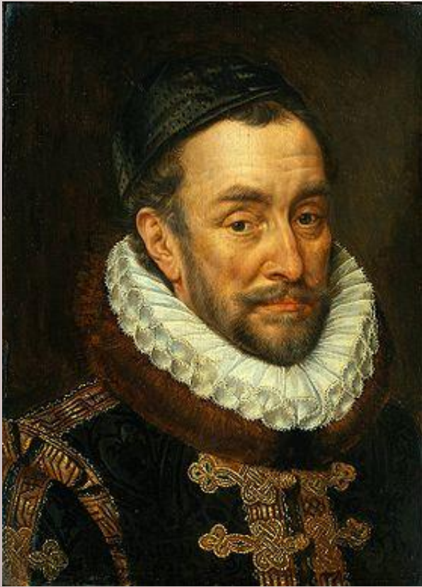
Вильгельм I Орлеанский