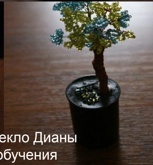
Работы Пекло Дианы 2 год обучения